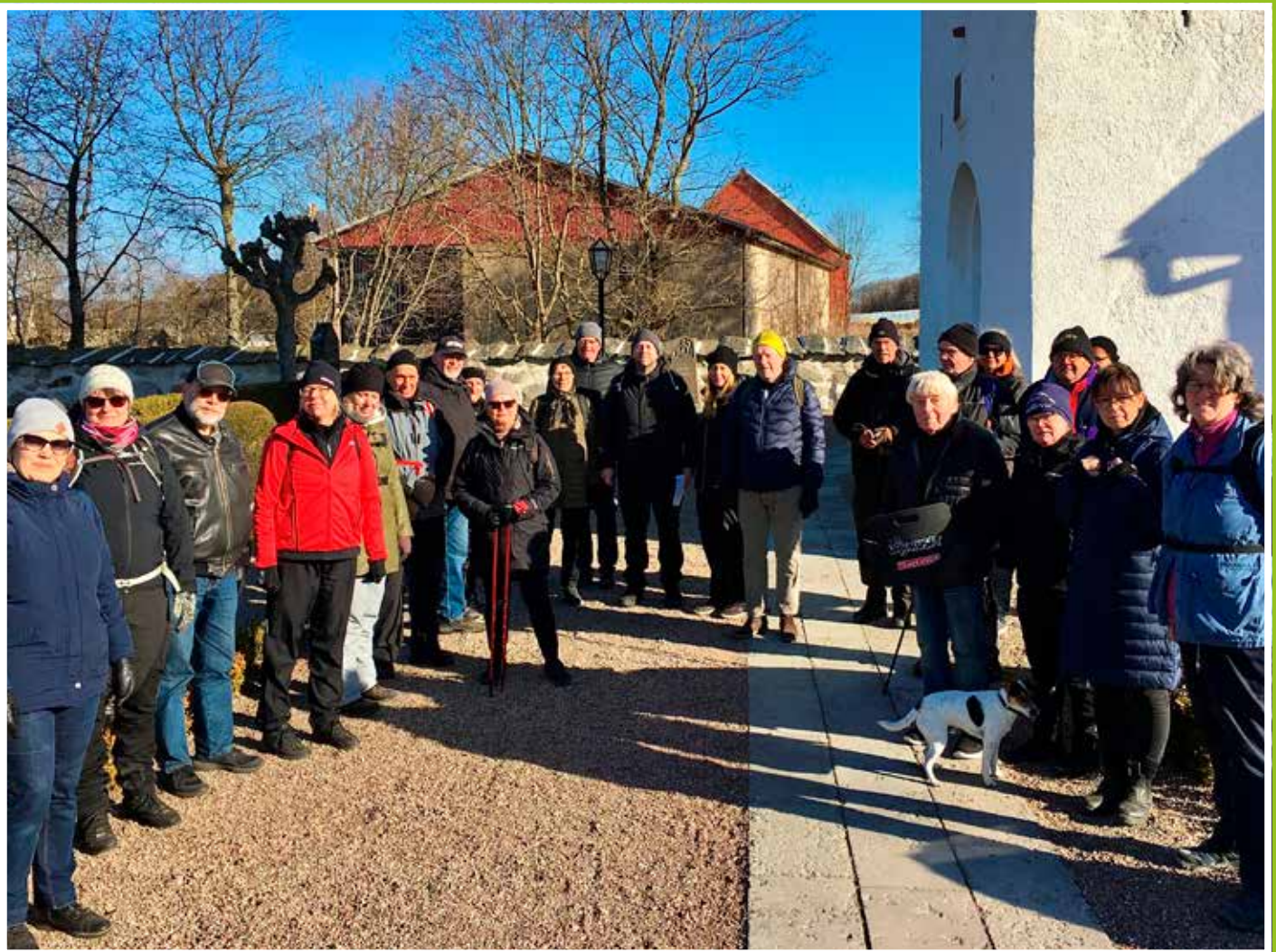
Pilgrimsvandring mellan våra kyrkor: från Ysane till Mjällby den 2 april 2022.