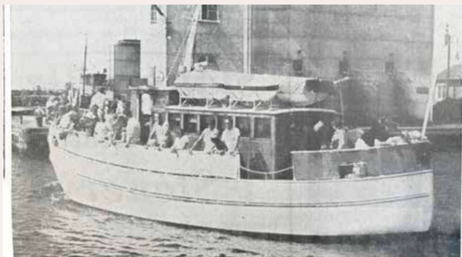
estbåten Sundspilen är för det mesta när den lämnar Nordersund för överfarten till ön fullpackad med turister som vill göra sig bekant med ön, eller återuppliva tidigare besök där ute.

24 juli Turistströmmen till Hanö slår alla rekord i sommar. Post- och passagererbåten ”Sundspilen” har nästan vid samtliga turer ut till ön varit fullpackad med turister.