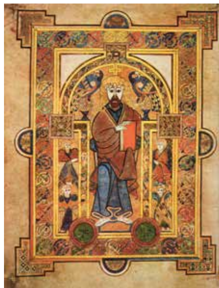
The Book of Kells Abbey of Kells

Munkar i klostret åstadkom synnerligen färgstarka, medeltida bibeltolningar på latin. Dessa spreds till östra England och vidare ut i Europa. Sverige som nation var långt avlägset. Vi var vikingar, hedningar.