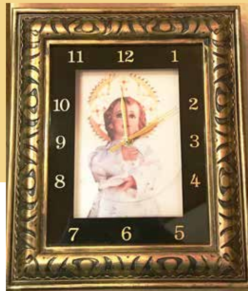
Eila Kastun työhuoneen Enkelikello- taulu.

Saarnajan kirjasta muistamme tutut sanat siitä, että kaikilla asioilla on määräaikansa. ”Kaikella on määrähetkensä, aikansa joka asialla taivaan alla.” (Saarnaja 3:1).