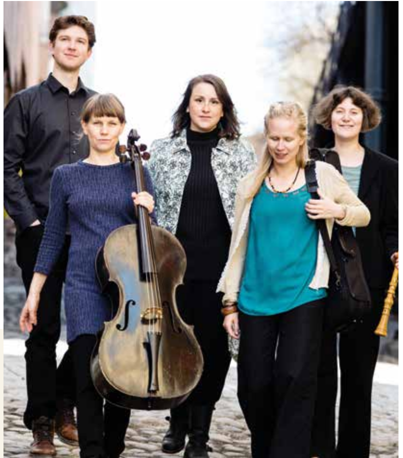
Brustna Hjärtan

Få av de kvinnliga barockkompositörer som existerat är kända och spelade idag men med tiden har kvinnors komponerande blivit mer synliggjord. Tre av dessa presenteras på konserten: pseudonymen och Londonbon Mrs. Philharmonica (ca 1715), den italienska nunnan Isabella Leonarda (1620-1704) och den franska musikern Elisabeth Jacquet de la Guerre (1665-1729). Brustna Hjärtan Barock är specialiserat på tidig musik och dess medlemmar har utbildningar från högskolor i Bremen, Basel och Stockholm.