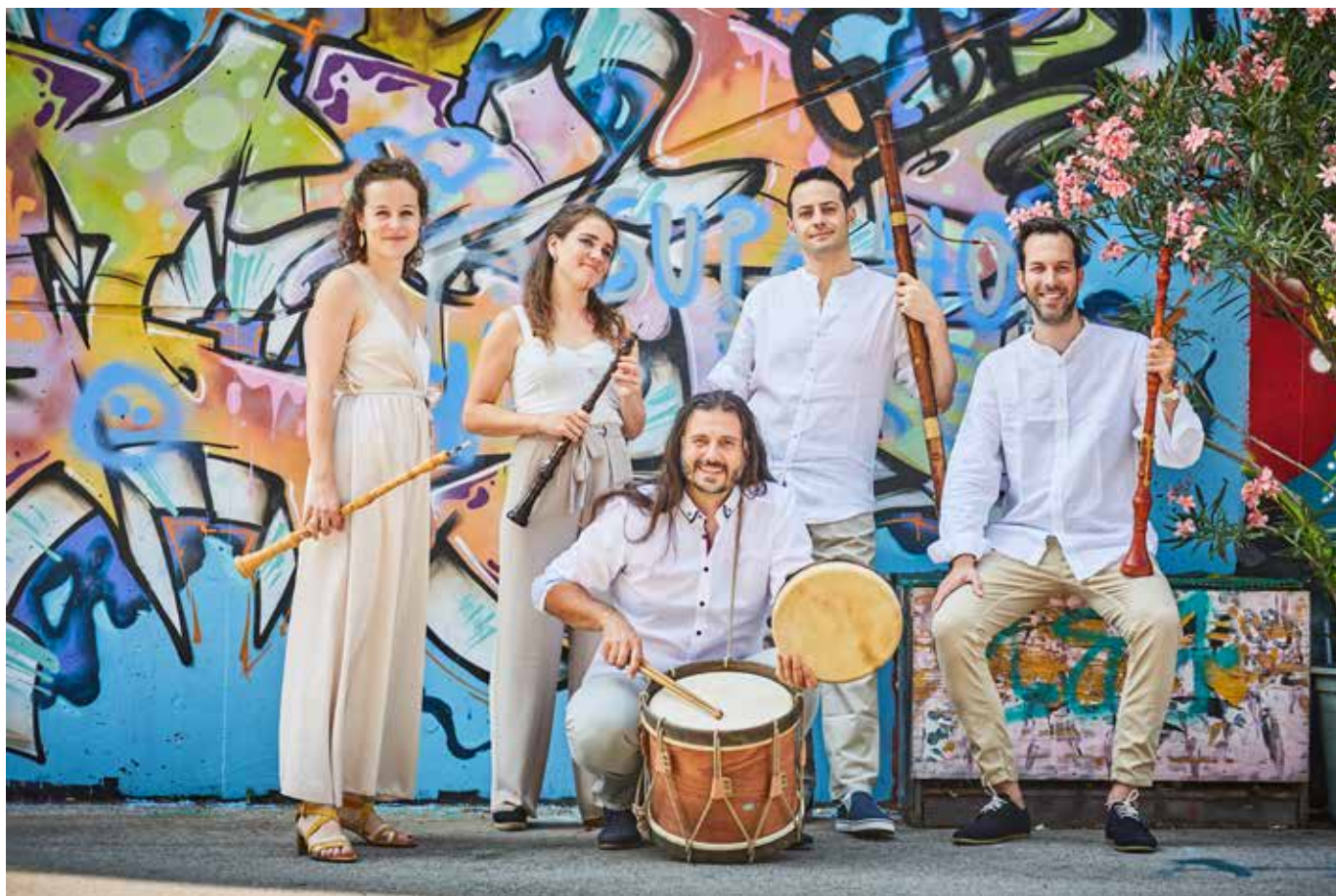
La Petite Écurie -