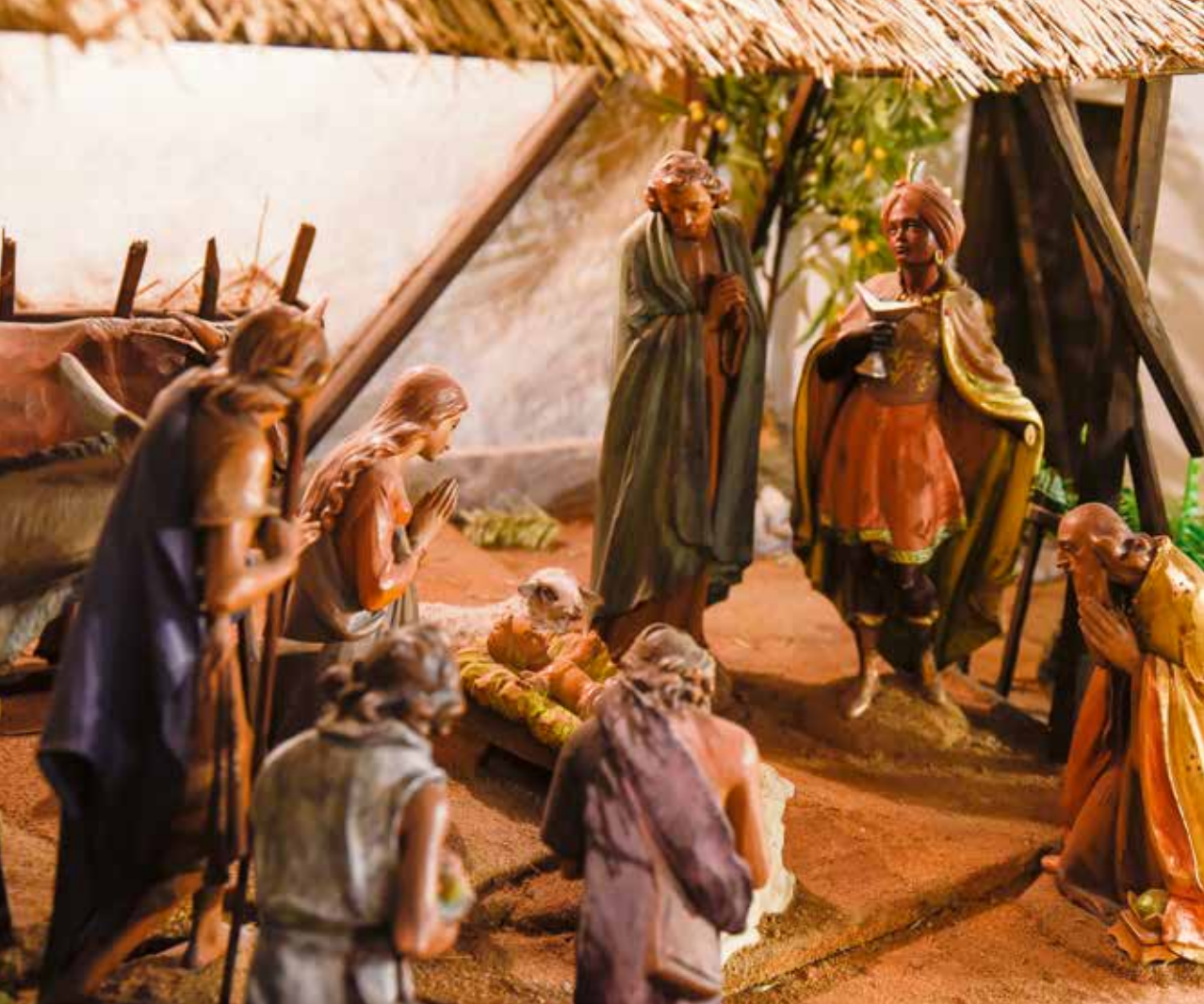
Engelbrektskyrkans julkrubba.