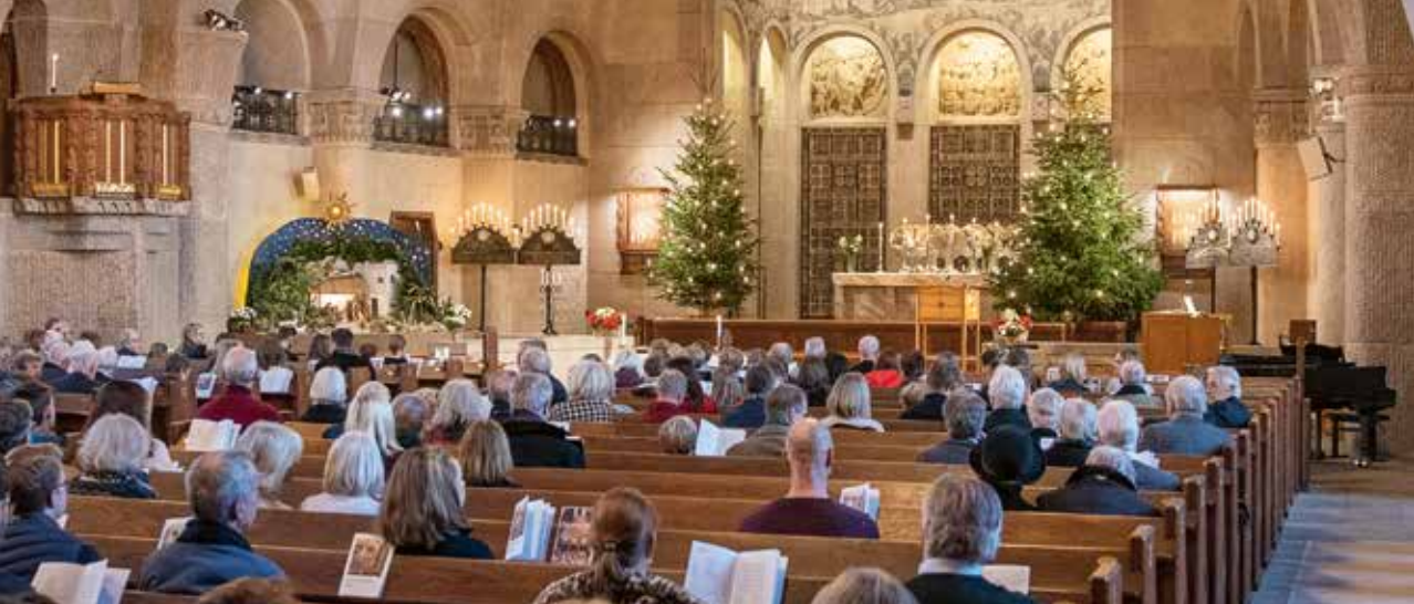
Adventsgudstjänst i Engelbrektskyrkan.