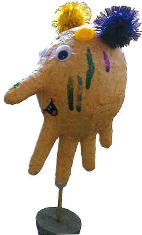
Änglaelefanter skapade av barn i Amnehärad-Lyrestads pastorat.

* Vi har ett avtal med familjecentralen i Gullspång och samarbete med förskola och skola i Gullspång, Lyrestad och Hassle. Flera av grupperna i Lyrestad och Hassle hämtas vid skolan.