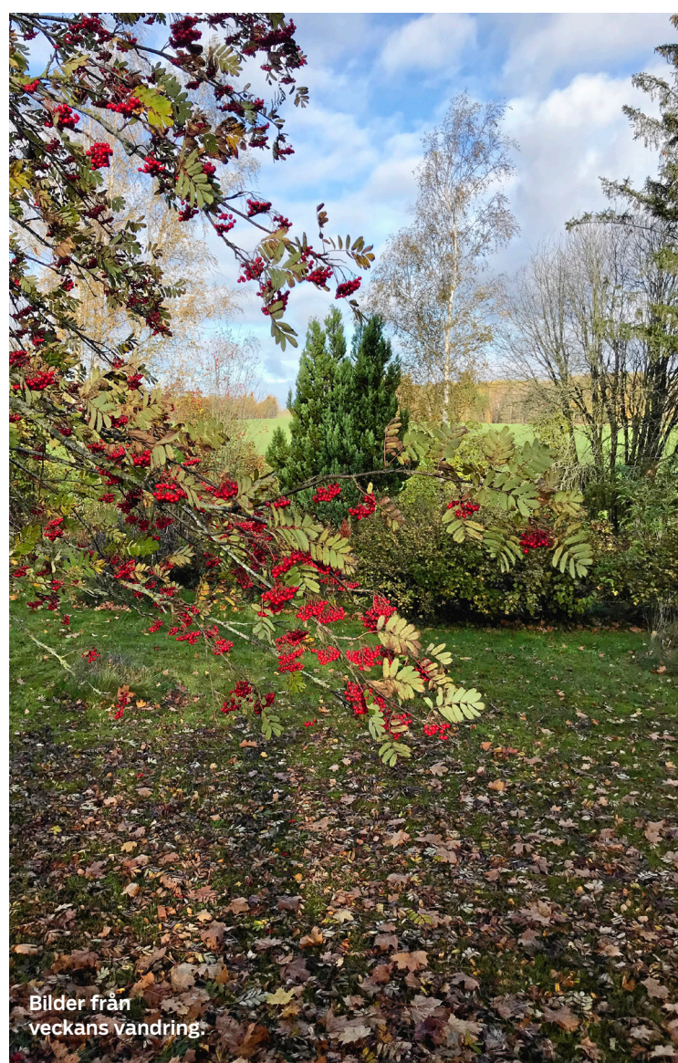
Bilder från veckans vandring.