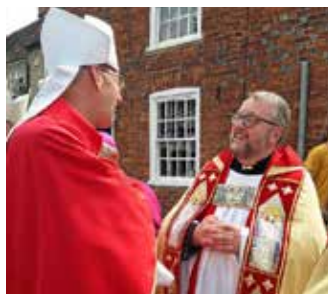
Trevligt samspråk med engelska kolleger i vänstiftet St Albans i England, juni 2018.

mot av domkapitel och stiftsstyrelse och samtidigt kyrkoherde.