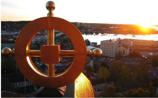
Hudiksvallsbygdens församling

Möt också Hudiksvallsbygdens församling som kyrka i detta.