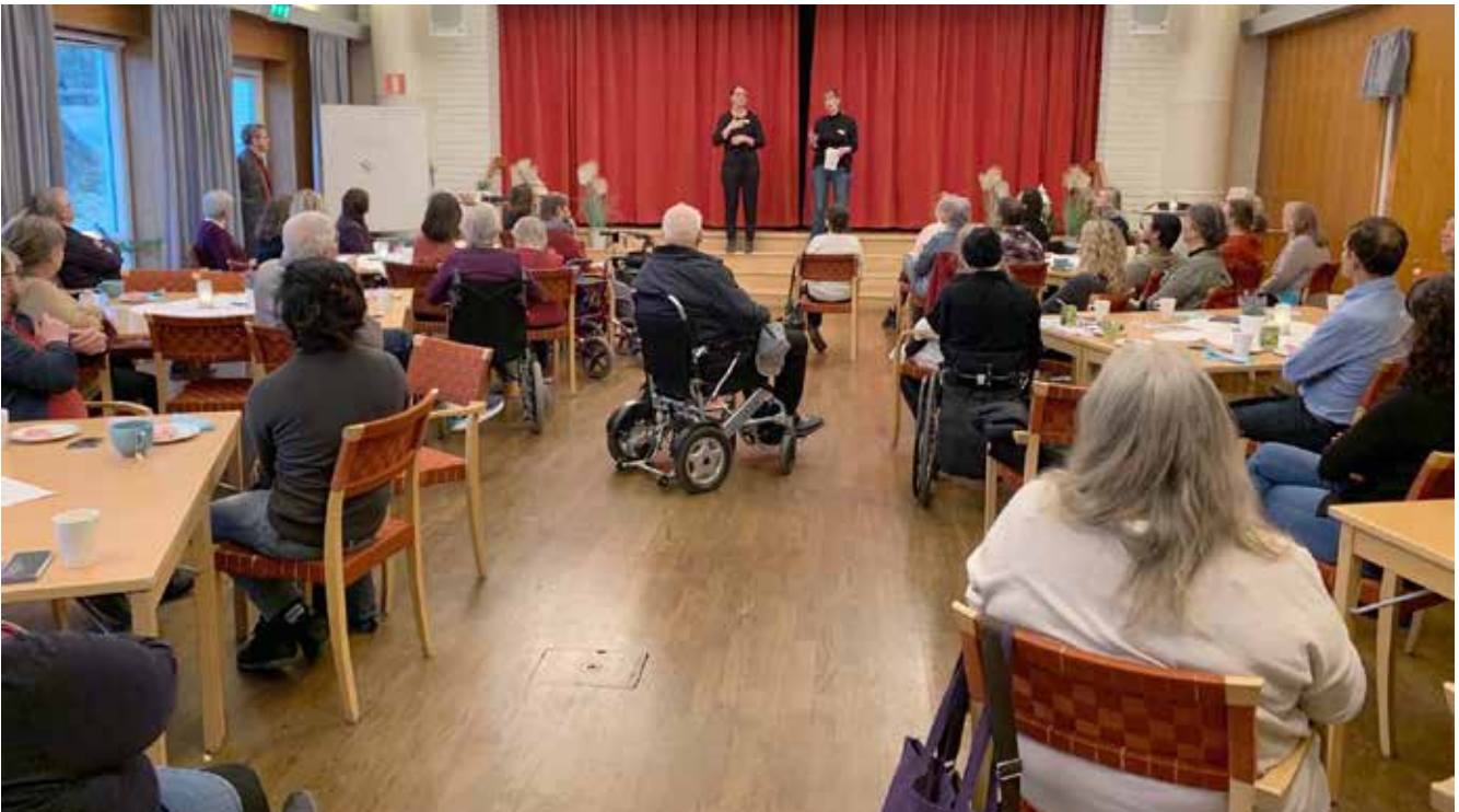
Över 60 personer samlades i Huddinge för att samtala om Stockholms stifts framtida teckenspråkiga verksamhet.