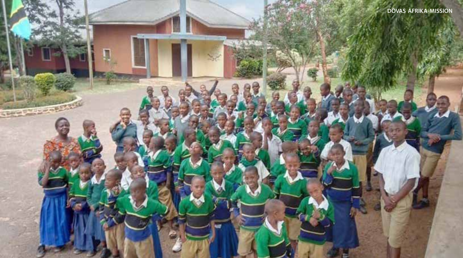
Mwangaskolans elever samlade utanför skolan.