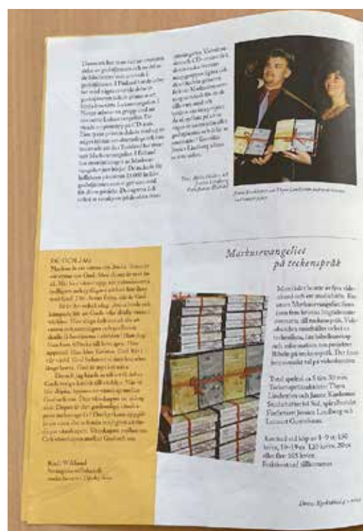
Fortsättningen på artikeln från Dövas Kyrkblad nr 1 2002.