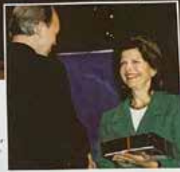
Drottning Silvia har med sig.