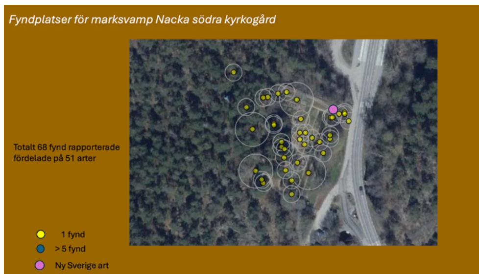
Figur 17. Här visas var svampfynd gjordes samt var områdets nya art för landet noterades. Patrick Fritzson.

Förutom ovanstående unika fynd gjordes ytterligare fynd av flera arter med endast ett fåtal tidigare svenska fynd (se Bilaga 1).