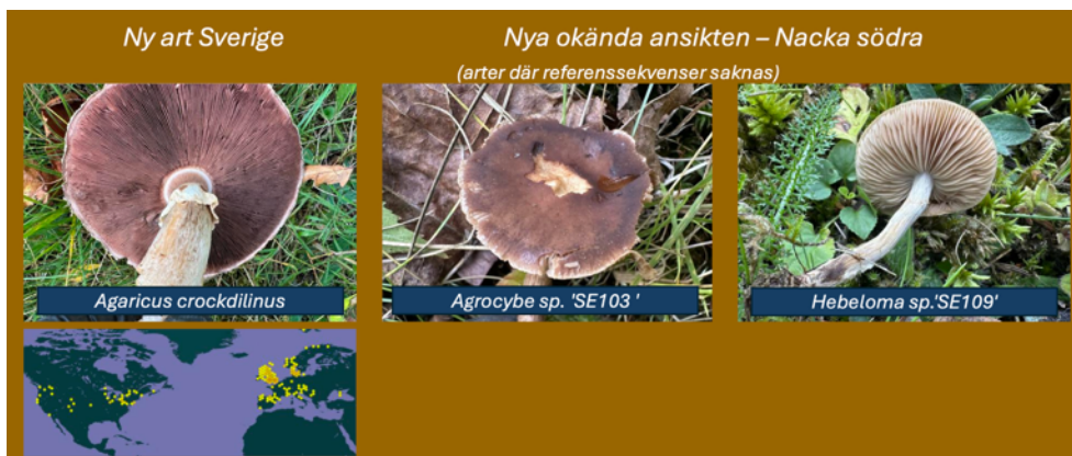
Figur 16. En ny art för landet påträffades. Det var en champinjon som skulle kunna få namnet "krokodilchampinjon" med anledning av dess vetenskapliga namn. Dessutom påträffades två arter som DNA-sekvenserades och visade sig vara för vetenskapen okända arter. Tack vare att sekvenserna sparas kanske de kan ges ett namn i framtiden.

Dessutom påträffades två arter som var för vetenskapen okända arter och där referenssekvenser saknas (se foto nedan på dessa). Tack vare att sekvenserna och svamparna sparas kanske de kan ges ett namn i framtiden.