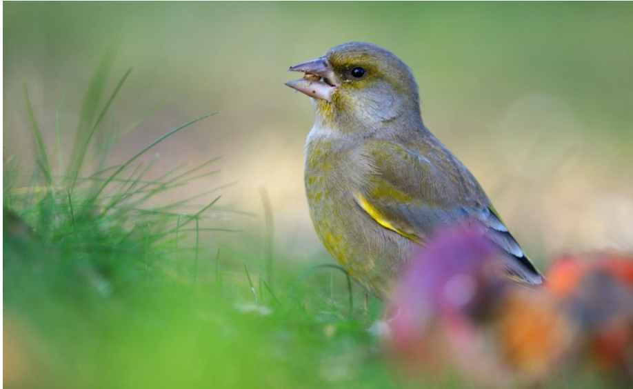
Figur 22. Grönfink är en av de rödlistade fågelarterna som sannolikt häckar i området.

Grönfink påträffades sjungande och bedöms häcka med ett par. Livsmiljön vid Nacka Södra kyrkogård är lämplig för grönfink.