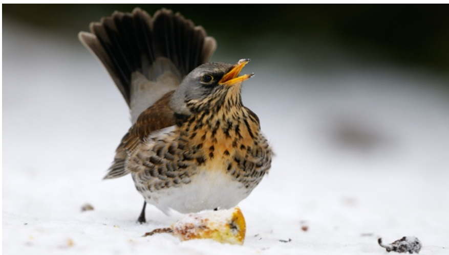
Figur 20. Björktrast häckade med ett par på Nacka Södra begravningsplats.