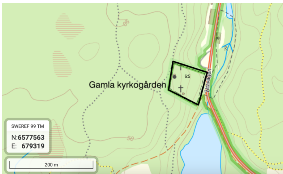
Figur 4. Inventeringsområdet för Nacka Södra kyrkogård, den Gamla kyrkogården.