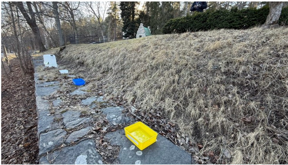
Figur 5. Gula, blå och vita plastskålar användes under insektsinventeringen, för att locka till sig bland annat pollinerande insekter. 22 mars.

Som ett led i att se begravningsplatsen och dess skötsel som en resurs avseende biologisk mångfald och för att anpassa skötseln, gjordes därför på uppdrag av Nacka kyrkogårdsförvaltning en inventering av tre begravningsplatser 2025. De tre begravningsplatserna var Nacka Norra kyrkogård (Nacka kyrka), Nacka Södra kyrkogård samt Storkällans begravningsplats, vilka alla antogs kunna ha en värdefull flora och fauna. I denna rapport redovisas resultaten från inventeringarna 2025 från Nacka Södra kyrkogård. Resultaten från Nacka Norra kyrkogård och Storkällans begravningsplats redovisas i separata rapporter.