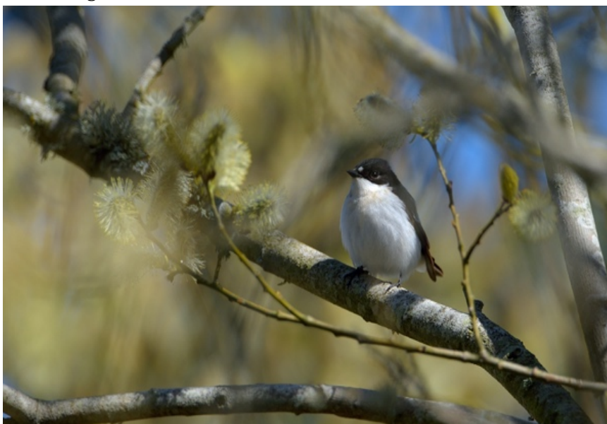
Figur 21. Den svartvita flugsnapparen påträffades sjungande våren 2025 på kyrkogården.

En hane påträffades sjunga här 2025. Om lämpliga holkar skulle sättas upp skulle området kunna erbjuda en fin häckningsplats för ett eller två par. Artens livsmiljökrav uppfylls väl i området men det är oklart om någon häckar här i nuläget.