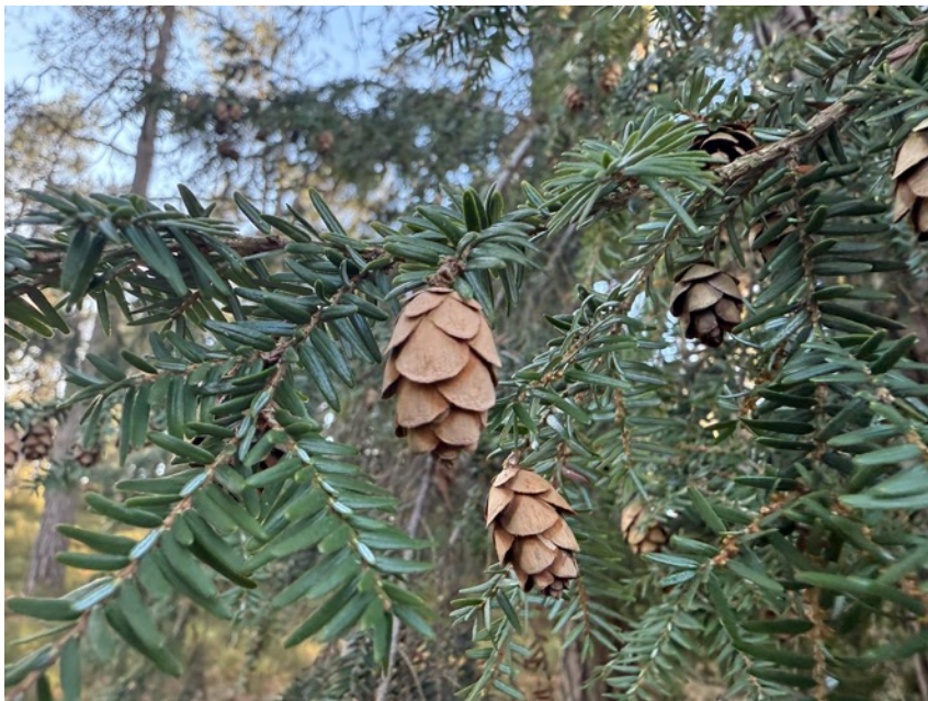
Figur 14. Långt upp i slänten finns det nordamerikanska trädet hemlock med sina typiska kottar. 22 mars.