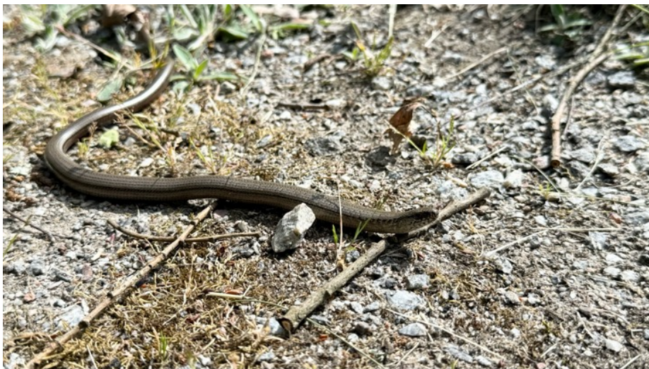
Figur 23. Denna kopparödla sågs på kyrkogården den 27 maj.

En art noterades under inventeringarna, nämligen kopparödla. Den har en mycket fin livsmiljö på kyrkogården.