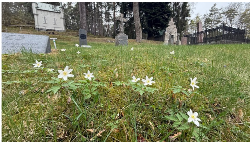
Figur 25. Vitsippor på kyrkogården den 23 april.