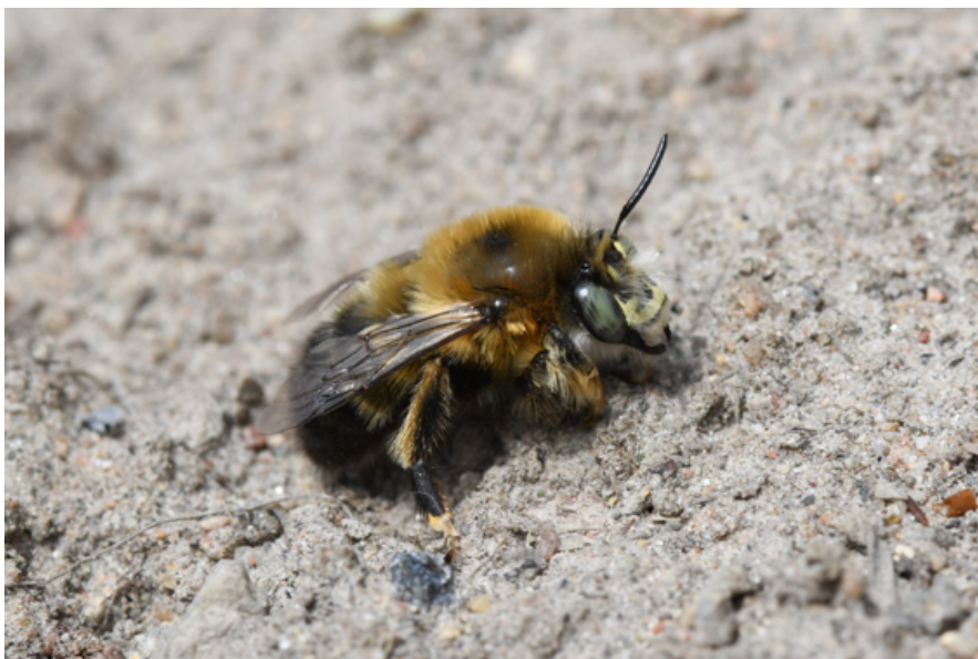
Figur 19. Svartpälsbi är en art som haft en fantastisk utveckling i Mälardalen. Fån utdöd till att vara på kraftig spridning. Detta lilla söta bi är ofta lätt att uppmärksamma när den kommer flygande med ett tydligt brummande ljud.

Av steklar noterades 139 arter totalt på de tre undersökta kyrkogårdarna, däribland 71 arter Apiformes (bin, av dessa 55 solitärbin), 29 Spheciformes (rovsteklar), 18 Pompilidae (vägsteklar) och 9 arter Vespidae (getingar). Vid Nacka Södra kyrkogård noterades 85 arter vilket är ett högt antal för ett så litet område.