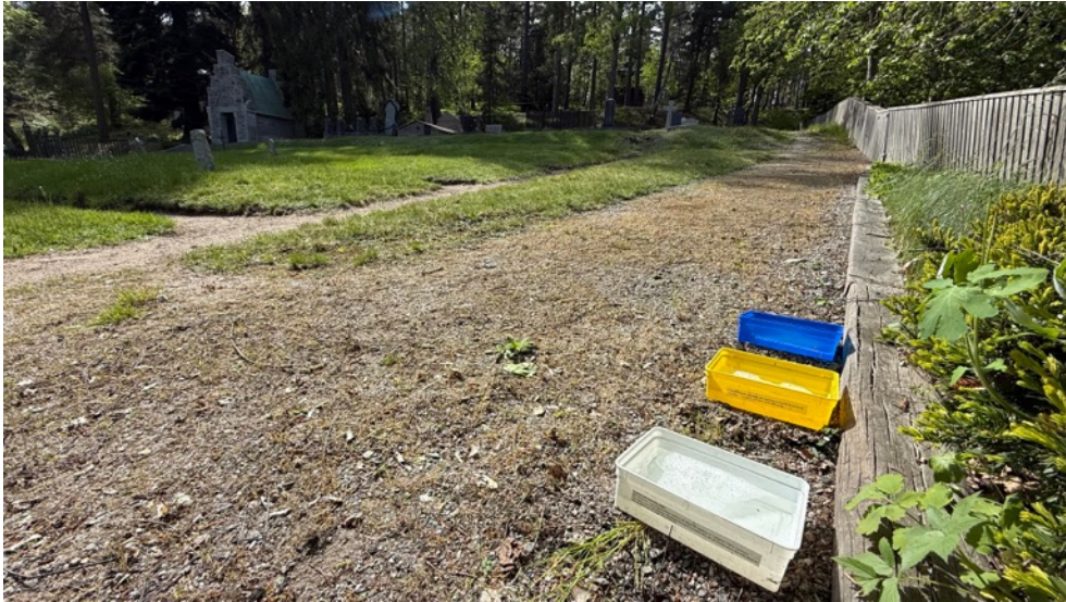
Figur 8. Färgskålar sattes ut av tre olika färger: gula, vita och blå. Dessa fångar framför allt pollinerande insekter, där olika arter lockas till olika färger. Skålarna tömdes med jämna mellanrum under inventeringssäsongen. De insamlade insekterna artbestämdes sedan av experter. 27 maj.