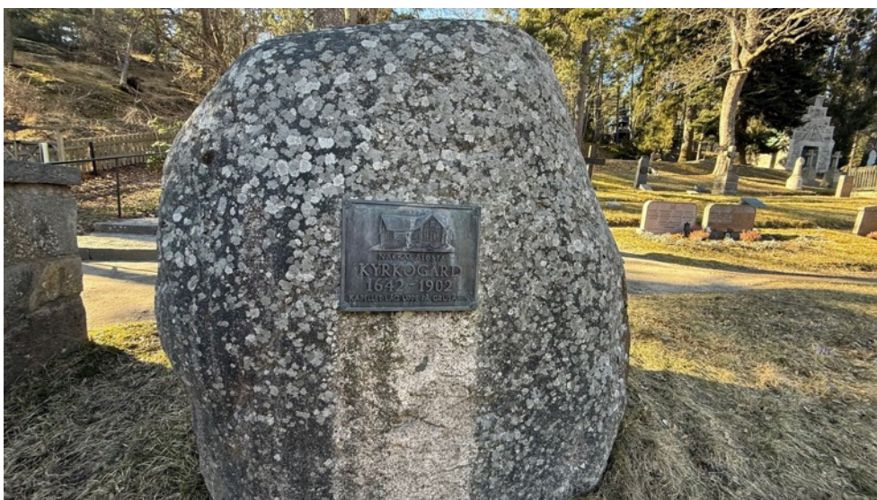
Figur 10. Minnessten vid ingången till begravningsplatsen. Nacka Södra kyrkogård är Nackas äldsta kyrkogård etablerad år 1642. 22 mars.

I följande avsnitt sammanfattas de mest intressanta resultaten samt allmänna beskrivningar av områdets flora och fauna.