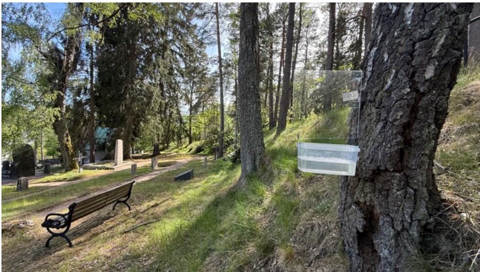
Figur 9. Fönsterfälla placerad på en vårtbjörk. 27 maj.