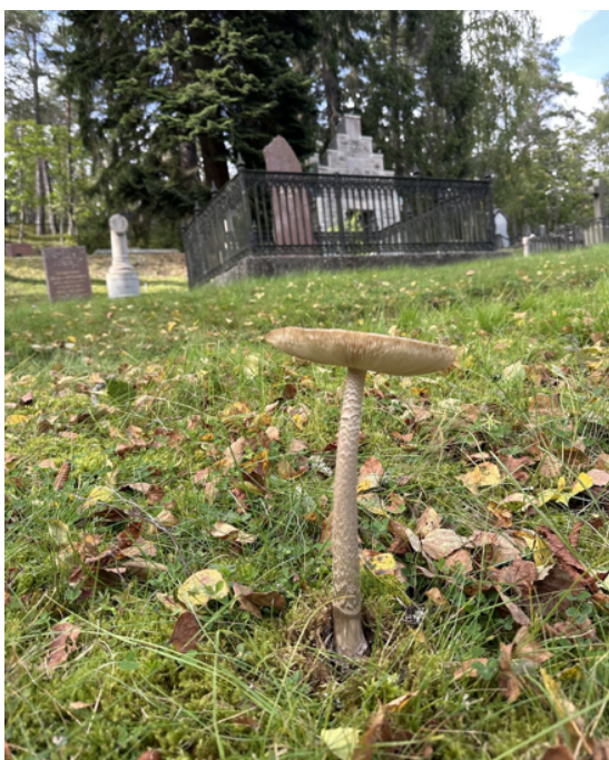
Figur 18. Denna rödlistade jättekamskivling (NT) växte på kyrkogårdens gräsmarker. 16 september.

Förutom alla ovanstående spektakulära fynd av både en ny art, okända arter och i övrigt arter med få tidigare svenska fynd gjordes även fynd av tre rödlistade arter: jättekamskivling (NT), skumticka (NT) och rödbrun rottryffel (VU).