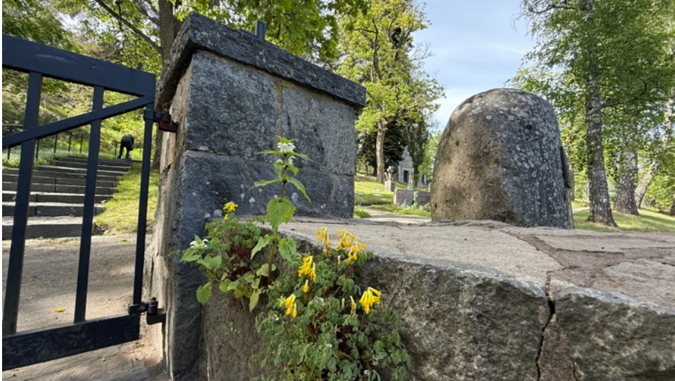
Figur 13. Vid ingången har denna gula nunneört hittat ett livsutrymme i murens sprickor. På bilden ses även vitplister. 27 maj.