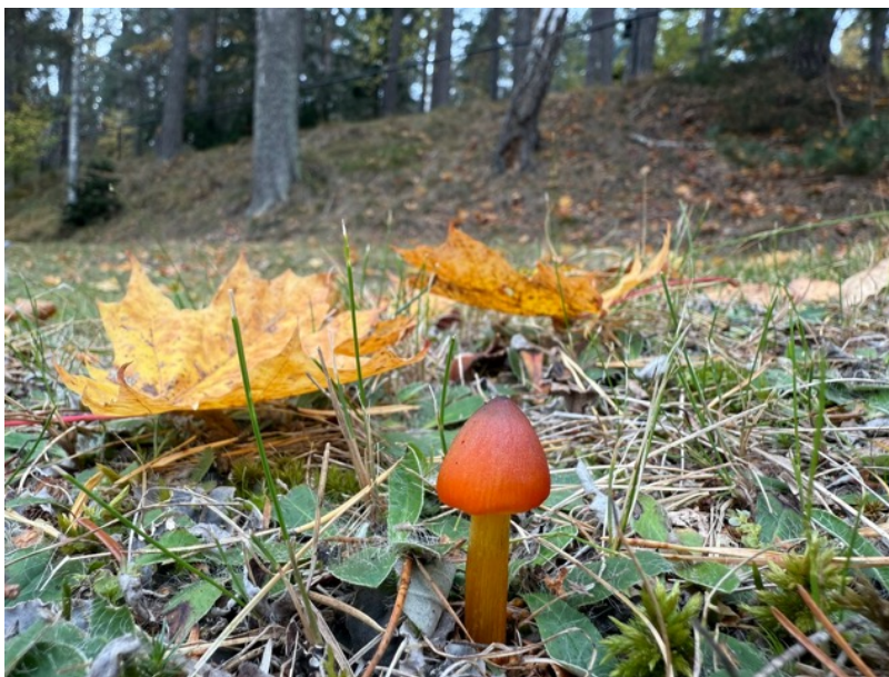
Figur 24. Denna toppvaxskivling finns på kyrkogårdens gräsmarker och indikerar höga värden som artrik gräsmark. Notera även håriga blad av gråfibbla, vilken också indikerar höga floravärden. 16 oktober.