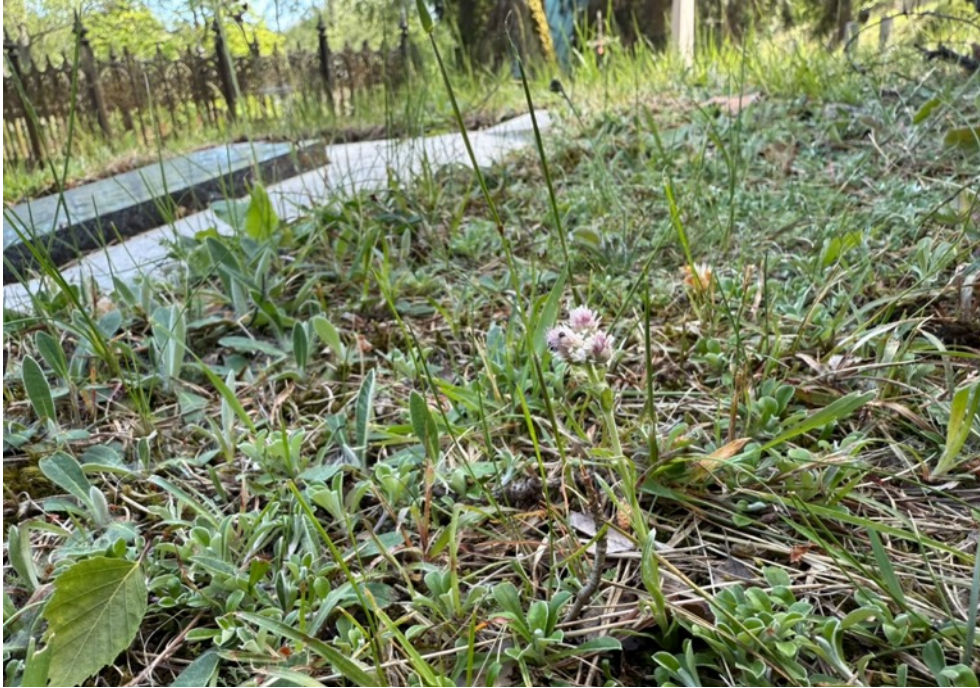
Figur 11. Kattfot är en av flera fina arter som indikerar höga naturvärden och som trivs på de sandiga näringsfattiga gräsmarkerna på begravningsplatsen. Här syns den blomma omgiven av en mängd bladrossetter. I vänstra delen av bilden syns håriga bladrossetter av gråfibbla. 27 maj.

I den övre delen av begravningsplatsen ingår ett litet parti med barrskog och här hittar vi bland annat typiska arter såsom tall, gran, blåbär och lingon.