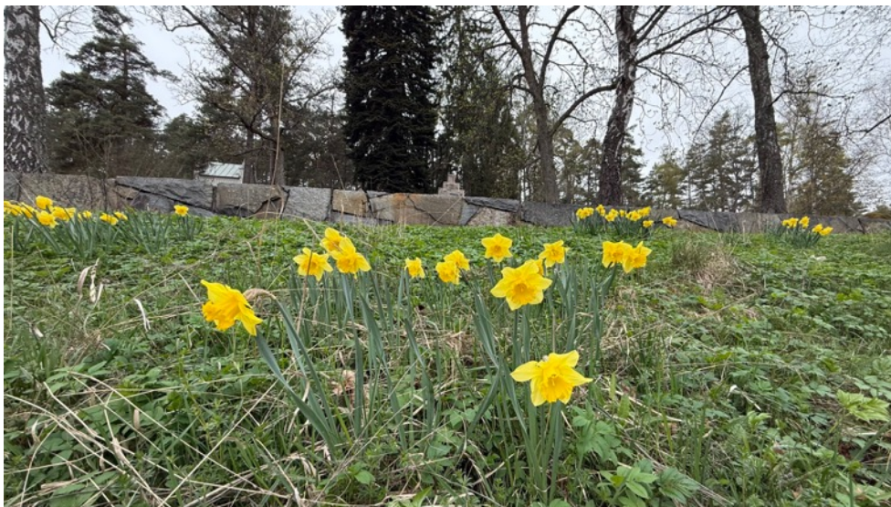
Figur 12. Vid Nacka Södra kyrkogård finns många lökväxter som är inplanterade och som sedan spridit sig i miljön. Här syns bland annat påskliljor på utsidan av muren. 23 april.

Precis som det ofta är i gamla parkmiljöer, och inte minst på kyrkogårdar, är vårfloran artrik. Vårfloran vid Nacka Södra begravningsplats är inget undantag. Här finns relativt många lökväxter som en gång i tiden planterats, varav många av dessa nu spridit sig och naturaliserats. Några exempel på dessa i området är: vårlök, dvärgvårlök, gullkrokus, snökrokus, vårkrokus, snödroppe, påsklilja och liten påsklilja.