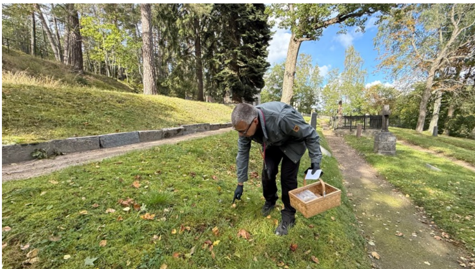
Figur 6. Nacka Södra kyrkogård, pågående inventering av svampfloran. 2 september.