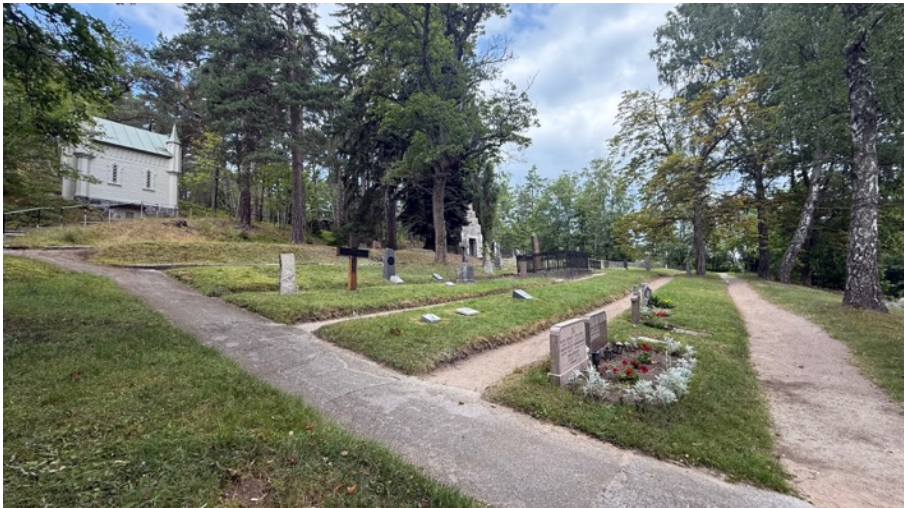
Figur 2. Här syns de sluttande gräsytorna med de sandiga gångarna. 8 augusti.