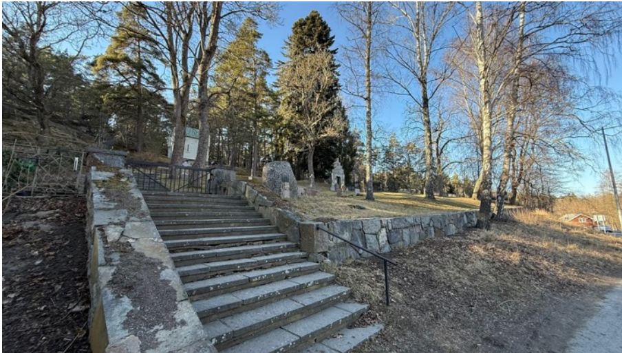
Figur 1. Entrén till begravningsplatsen. 22 mars.

Begravningsplatsens verksamhet har alltså gett förutsättningar för en rik biologisk mångfald och markerna bör fortsätta att skötas på liknande sätt som hittills. Det allra viktigaste är att man inte tillför någon extra näring till gräsmarkerna. Just det att de är näringsfattiga är det som ger den stora mångfalden. Sedan är det viktigt att hela tiden se till att det finns blottade sanddytor till området rika bifauna med solitära grävande bin. Dessutom skulle holkar för fåglar, fladdermöss och insekter vara positivt samt att lämna orörda delar där djur kan söka föda, hitta skydd och finna boplatser. Skapa även gärna faunadepåer med död ved, vilket kan gynna både insekter och svampar. Och sist men inte minst. Visa upp och informera om kyrkogårdens biologiska mångfald. Detta är något som både kan öka kunskapen om vår fauna och flora och förståelsen för det viktiga arbete kyrkan gör för områdets natur.