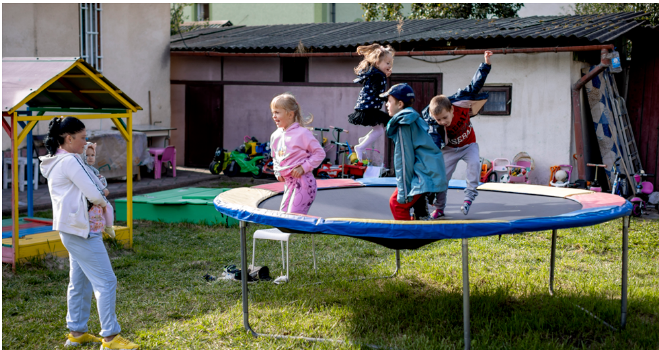
Act Svenska kyrkan arbetar tillsammans med lokala partner i Ukraina för att nå de mest sårbara grupperna. Detta boende med lekplats i västra Ukraina är ett av många exempel på verksamheten.