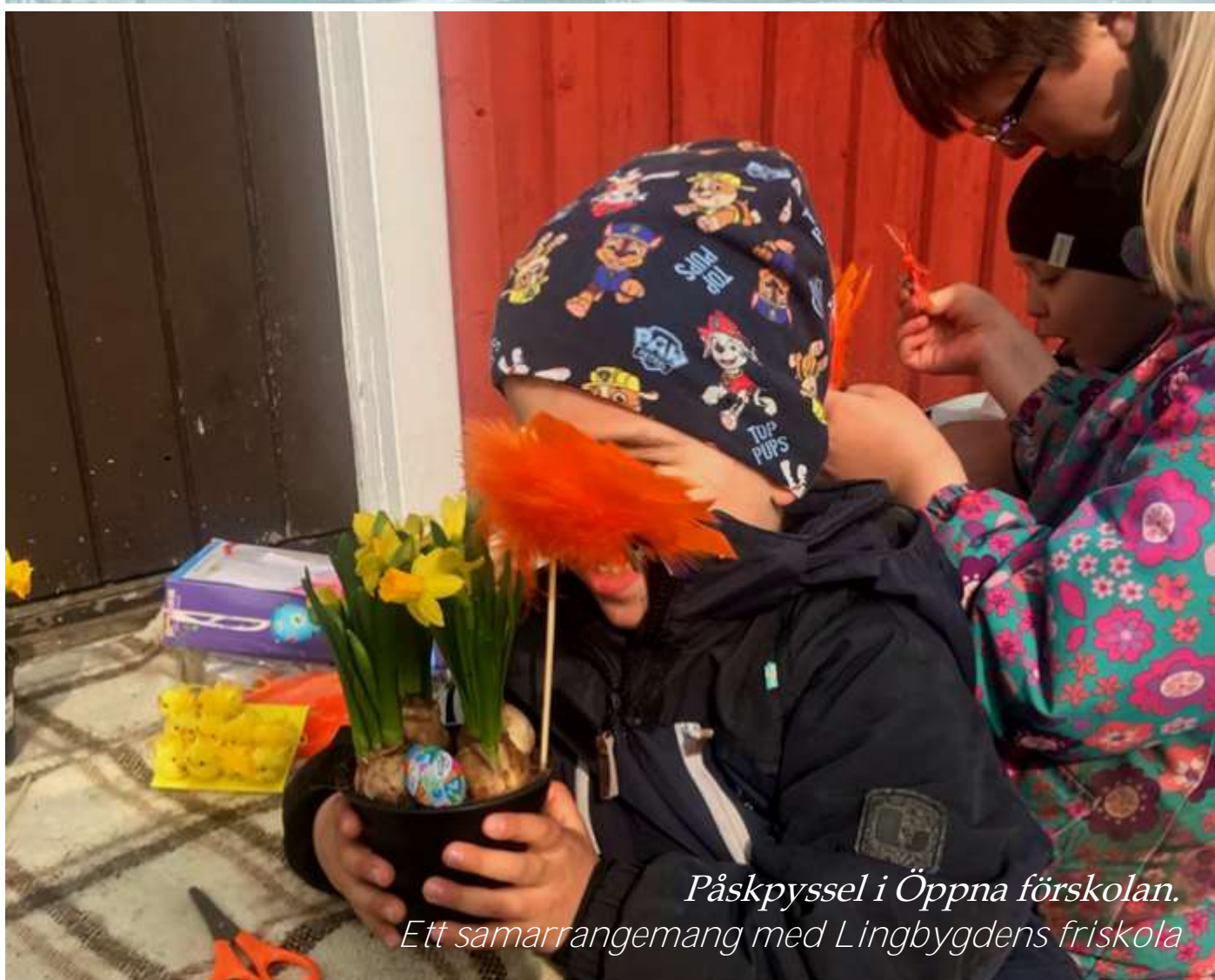
Påskpyssel i Öppna förskolan. Ett samarrangemang med Lingbygdens friskola

Vårtecken och fasta sid. 4 Nya kyrkorådet sid. 10