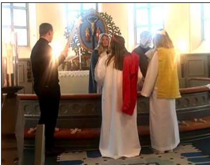
Nedan: Kyrkspel med konfirmanderna på Trettondagen.