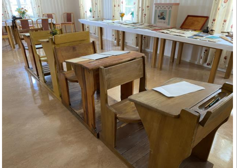
Foton från utställningen om Nöttja gamla skola under tältveckan i Nöttja.