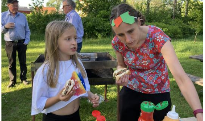
I juni hade vi ett familjeläger på Södra Ljunga vandrarhem. Ett roligt läger som avslutades med familjegudstjänst i kyrkan.

att när du kommer till kyrkan, så möter du en skylt på parkeringen: " Idag firar vi gudstjänsten i församlingshemmet." Allt av ekonomiska skäl. Det som är glädjande i alla dessa dystra siffror och prognoser är att vi har roligt när vi firar gudstjänst. Ofta är minglet