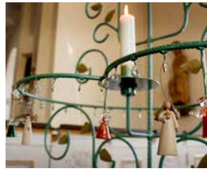
Dopträdet. Här kan du hänga ditt nyförvärv, dopängeln. Stå och njut ett kast innan din färd genom kyrkorummet bär vidare.