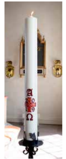
Kristusljus. A och O. Jesus uppstod. Livet återvänder. Både i naturen och i våra liv. Kristusljusen tänds på nytt under påskdagen. Sedan lyser ljuset vid olika gudstjänster och mässor, tills ett nytt påskljus ska tändas igen på påskdagen nästkommande år.