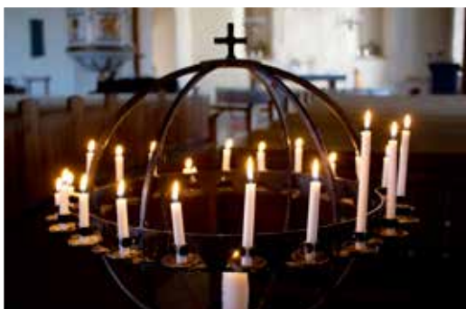
Ljusbärare. Stanna upp lite och stå över ett kast vid ljusbäraren. Tänd ett ljus och be för någon eller något som behöver din omtanke.