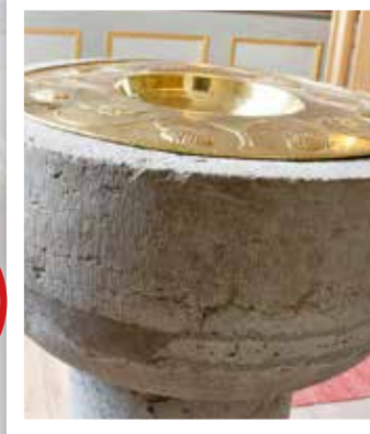
Dopfunt. Oberoende av om du är 80 år eller nyfödd bebis kan du bli döpt. Gud kommer oss till mötes i dopet. Här får du också en dopgåva, till exempel en ängel. Gå vidare till dopträdet och häng upp din nya dopängel. Slå ett extra kast.