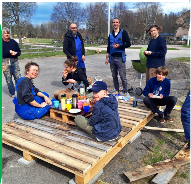
En paus i arbetet att montera skateboardrampen i Pjätteryd. Den invigdes 16/5 med endast inbjudna p.g.a. av pandemin.

Blir det fritt eller 500-gräns är det bara att komma! Medtag fikakorg.