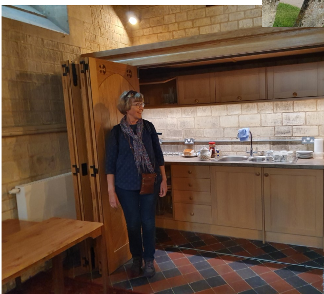
Små och gamla kyrkor