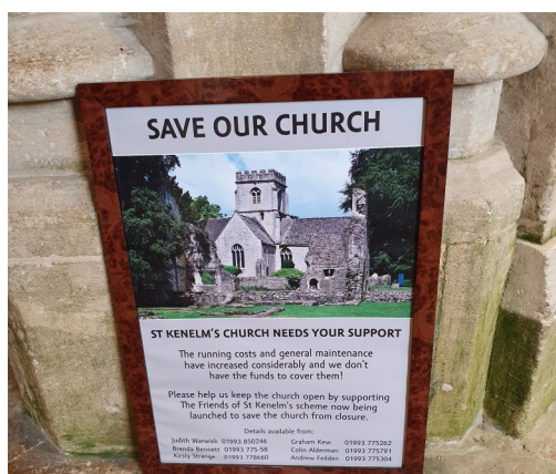
Kyrkorna är beroende av församlingsbornas bidrag