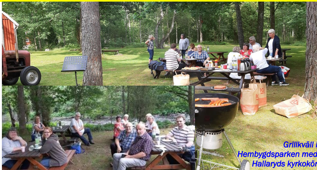
Grillkväll i Hembygdsparken med Hallaryds kyrkokör