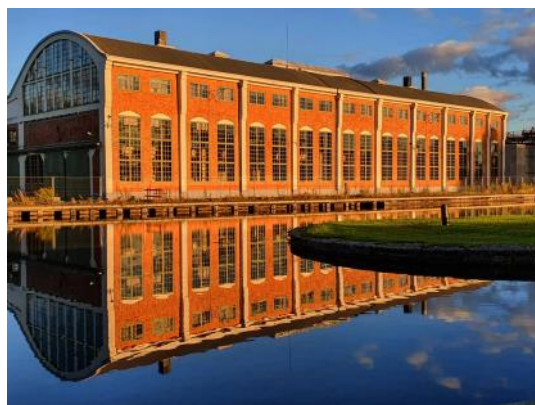
Lokverkstan i Motala verkstad, ett foto från närmiljön.

TEXT: MALIN STREHLIN