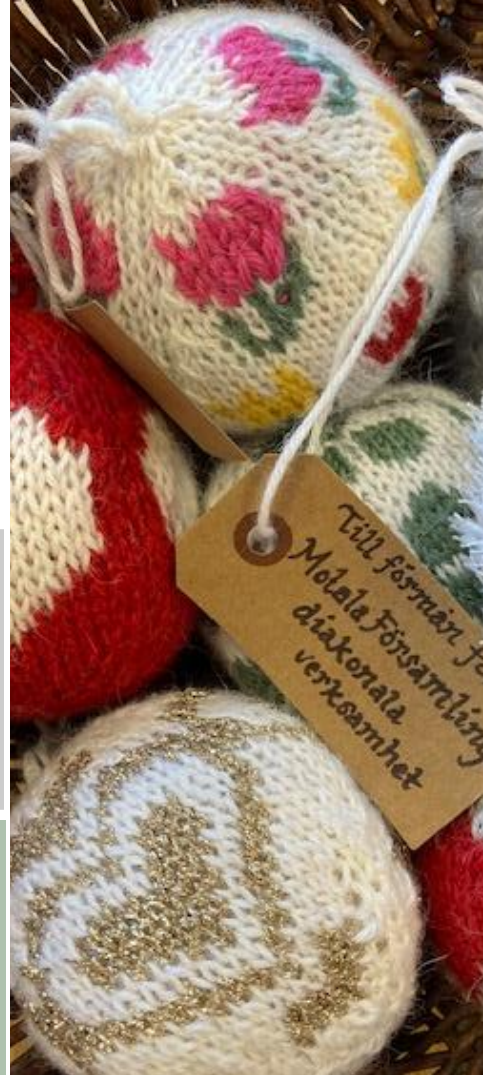
De stickade alstren finns i Motala kyrka.