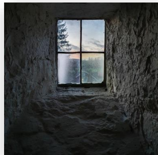
Fönster från Ekebyborna kyrka