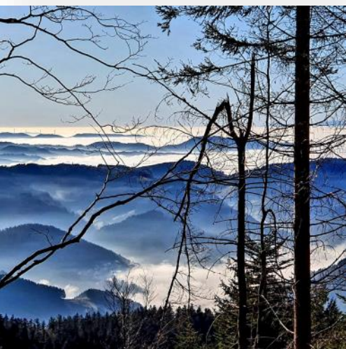
Bergstoppar i Schwarzwald, Tyskland.