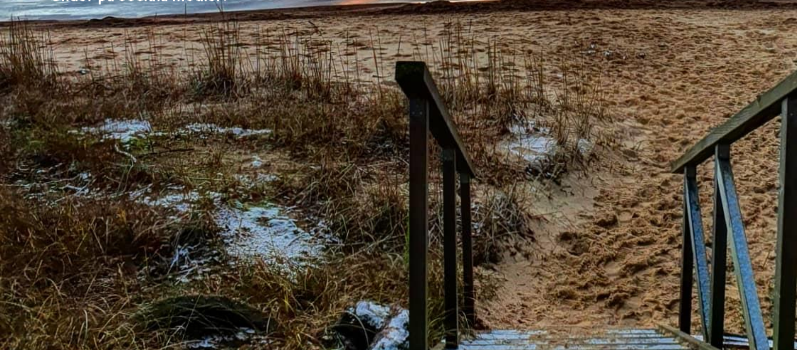
Vy över Varamobaden, Motala