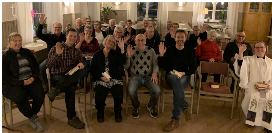
Gruppbild från böneveckan

Sedan några år tillbaka arrangeras den ekumeniska böneveckan i början av året. Här samlas traktens församlingar och eldsjälur till bön där vi ber för varandra, vår bygd och de styrande i vårt land. Den gemensamma böneveckan inleddes med en mässa den 18 januari och avslutades med en liknande veckan därpå. En nyhet från tidigare år var att vi nu hade alla sammankomster i Kyrkans Hus mot tidigare år i garaget. Nu blev det mer plats, ombonat och komfortabelt för alla deltagare! /Stefan Öberg, kyrkoherde