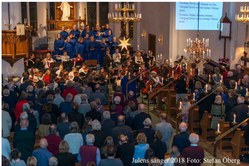
Julens sånger 2018

Antal medlemmar i församlingen 2019-02-01.