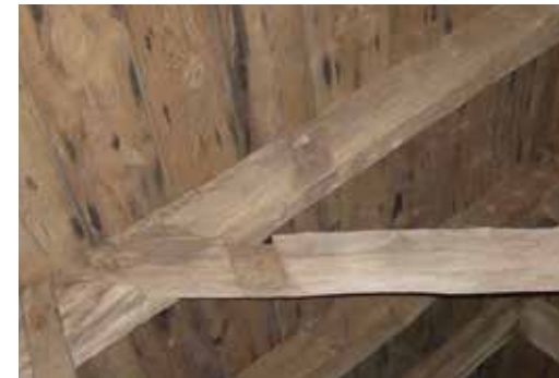
Taklag i Farhults kyrka där man ser att virket tidigare använts i en äldre taklagskonstruktion.