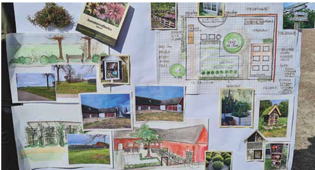
Enligt dessa skisser och bilder bygger man upp trädgården

Förhoppningen är att trädgården ska vara igång till hösten och då är alla välkomna!