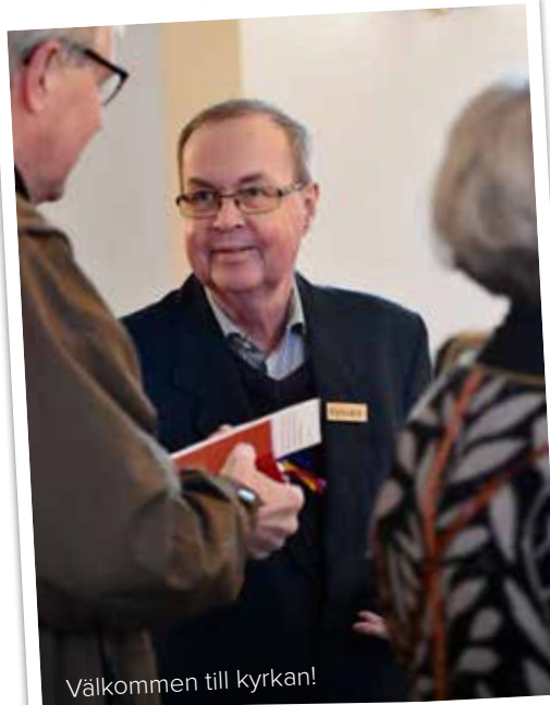
Välkommen till kyrkan!