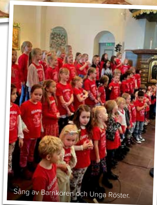
Sång av Barnkören och Unga Röster.