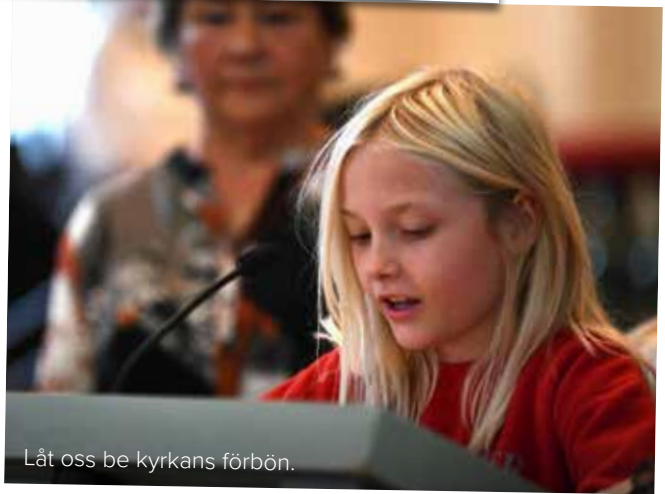
Låt oss be kyrkans förbön.