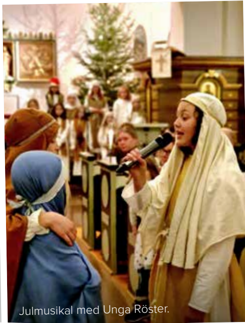
Julmusikal med Unga Röster.