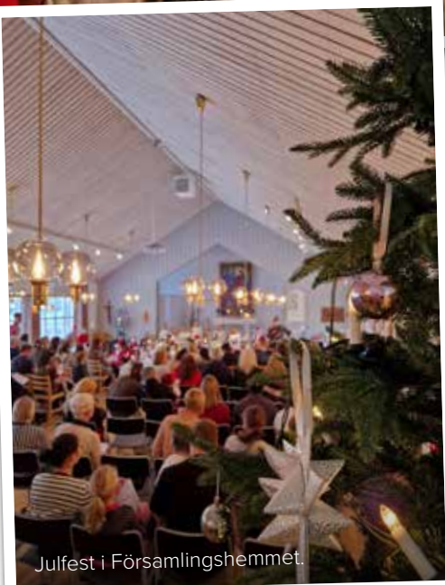
Julfest i Församlingshemmet.