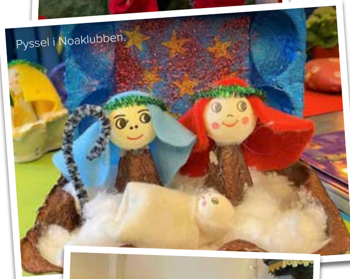
Pyssel i Noaklubben.