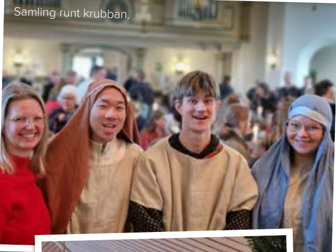
Samling runt krubban.

Vi gillar Älmhult för dess natur och värmande gemenskap. Det är ett fantastiskt ställe för en familj att bo och växa i.