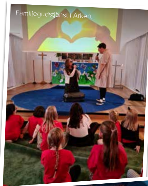
Familjegudstjänst i Arken.

Jag vill jobba med något av mina intressen, kanske inom medicin eller något liknande.