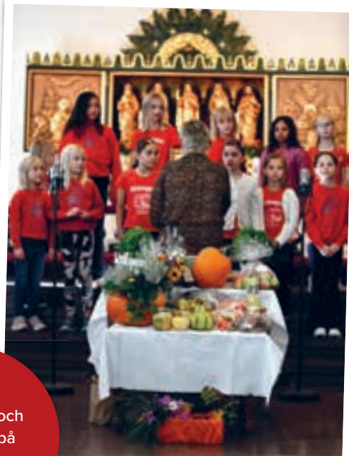
Gudstjänst och kyrklunch på Tacksägelsdagen.