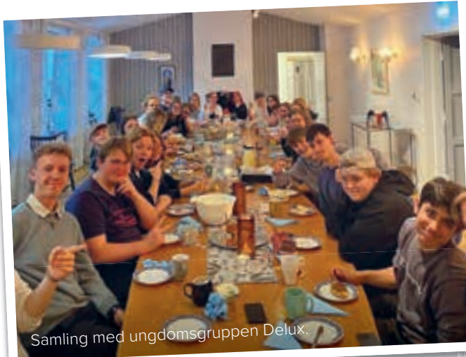
Samling med ungdomsgruppen Delux.