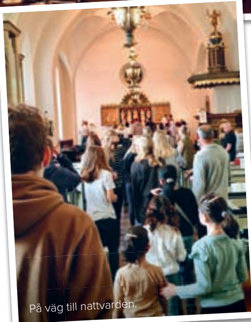
På väg till nattvarden.

Under decennier har det firats gudstjänst och mässa på våra äldreboenden, ena veckan på Almgården och andra på Nicklagården. Präst, kantor och diakon är där i stort sett varje gång. Själva kyrkorummet för gudstjänsten har varierat men torsdagar kl 10.30 står fast. Det är en fin tradition och en viktig gudstjänst för dem som inte längre kan ta sig till kyrkan.