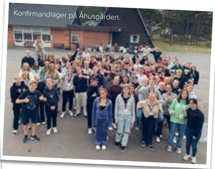
Konfirmandläger på Åhusgården.