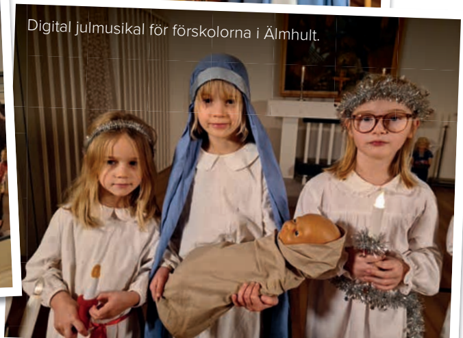
Digital julmusikal för förskolorna i Älmhult.