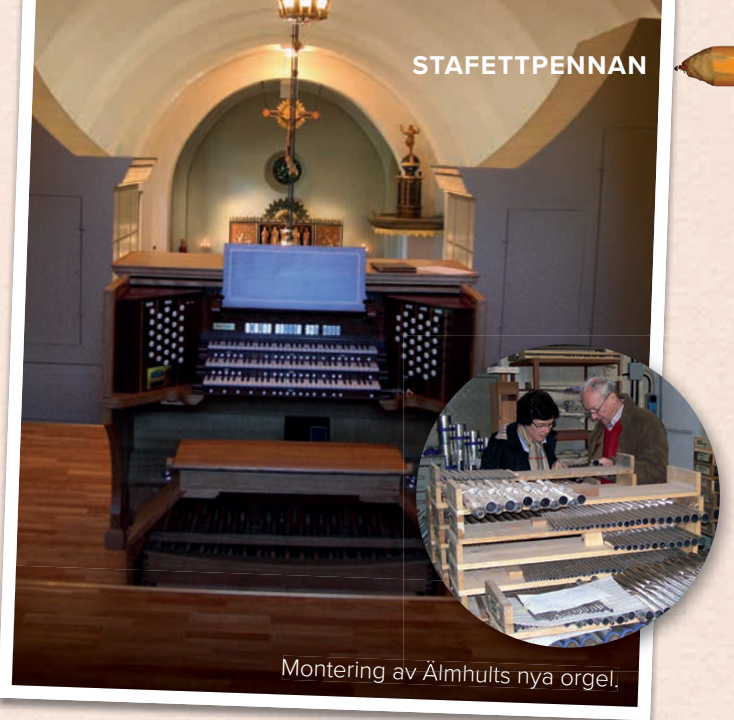
Montering av Älmhults nya orgel.

Jag har varit med när vi anställt de två senaste kyrkoherdarna och det har ju i båda fallen blivit mycket lyckat. När jag läser om alla tråkigheter i olika församlingar i landet är det så fantastiskt att våra kyrkoherdar har sett till att få en så god stämning i, som det nu heter, arbetslaget. Denna goda stämning sprider sig till all verksamhet i församlingen, i gudstjänsterna, i körerna, de många konfirmanderna, bland oss förtroendevalda med mera.