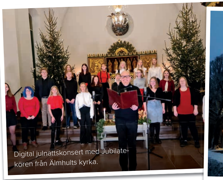
Digital julnattskonsert med Jubilatekören från Älmhults kyrka.