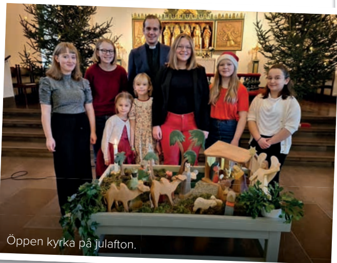
Öppen kyrka på julafton.