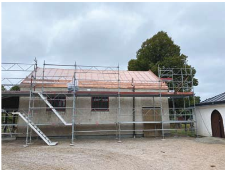
Gravkapellet på Rödeby kyrkogård genomgår just nu en yttre renovering.

en välfungerande avvattning och fasadputs som håller bättre än dagens. Sprickorna ska armeras med rostfritt armeringsjärn och fasaden ska avfärgas med silikatfärg.