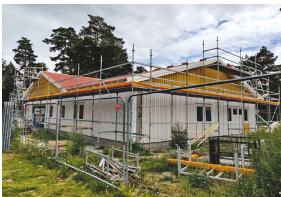
Den nya delen av Senapskornet börjar nu ta form.

vara samlade på samma arbetsställe och en fin ny byggnad.