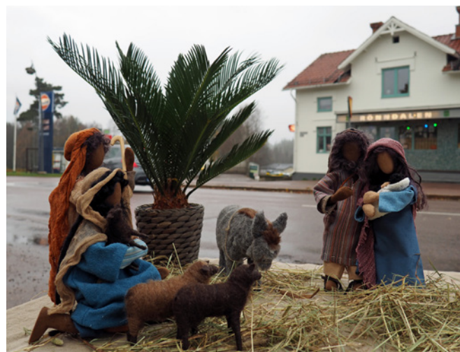
Krubba mitt i byn

Ett litet barn föddes och lades i en krubba för över 2000 år sedan. Barnet kom att växa upp och få en stor betydelse för människor världen över.