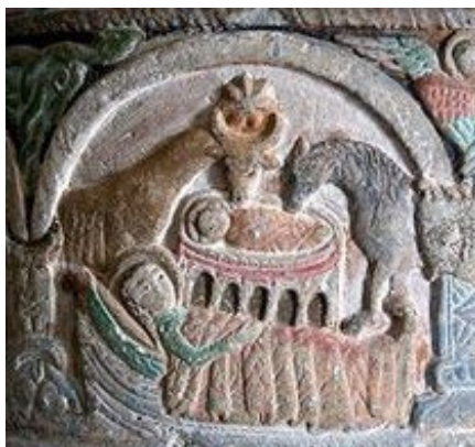
Bild av krubban på dopfont i Alskogs kyrka på Gotland.

En oxe och en åsna står och tittar ner i krubban, deras lugna andedräkter värmer det nyfödda barnet. Det är en rörande bild och den allra första framställningen av Jesu födelse i konsten.