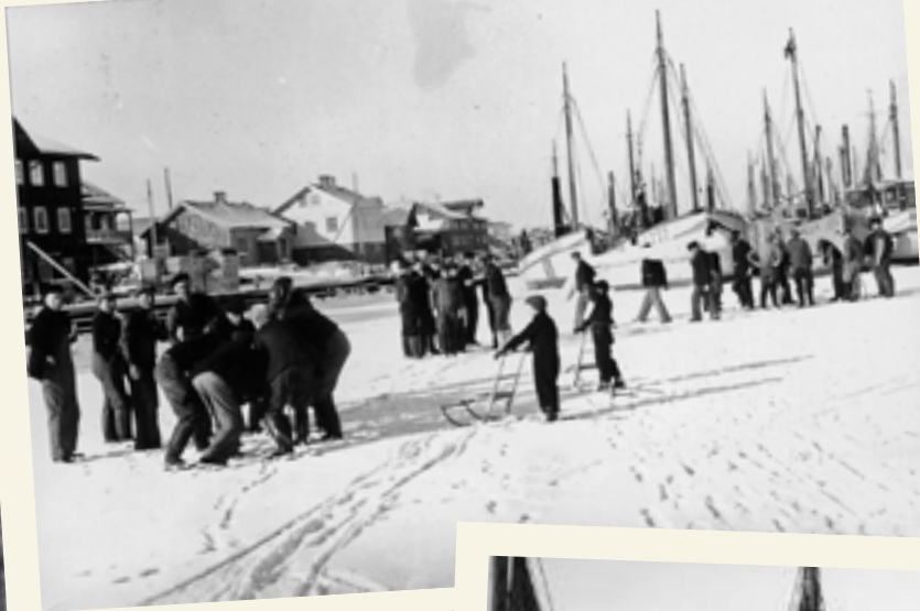
En frusen hamn på Smögen, 1942.