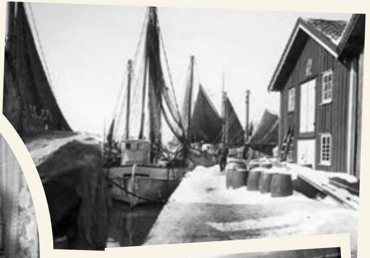
Båtarna vilar från fisket julen 1924.