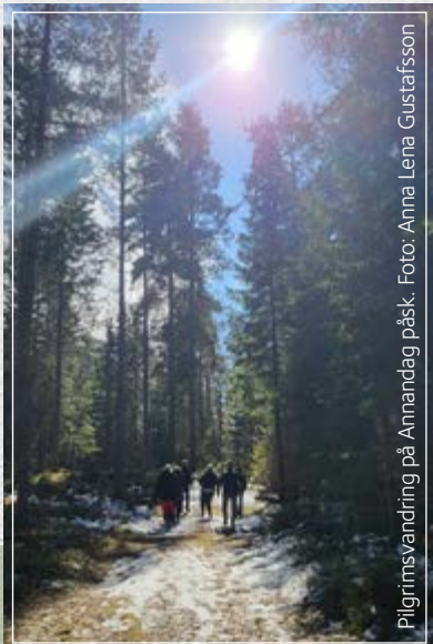
Pilgrimsvandring på Annandag påsk.