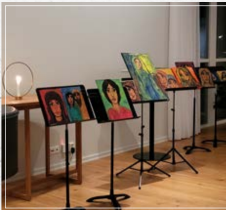
Eva Söderström tavlor Foto: Anna Lena Gustafsson