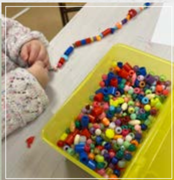
Öppen förskola