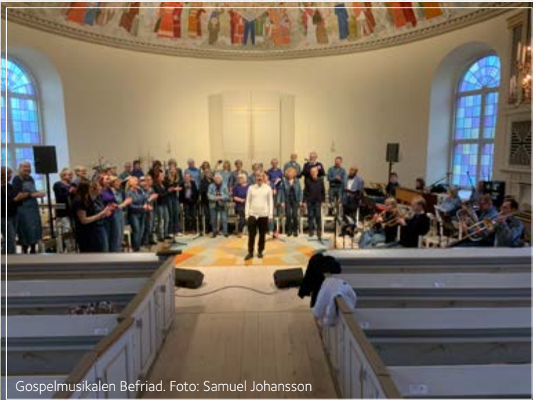
Gospelmusikalen Befriad.