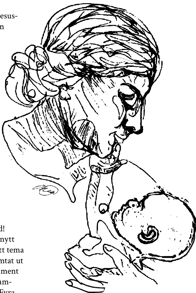
ILLUSTRATION: THEA ANDERSSON

Tidningen ges ut av Svenska kyrkan, Roslagens norra pastorat