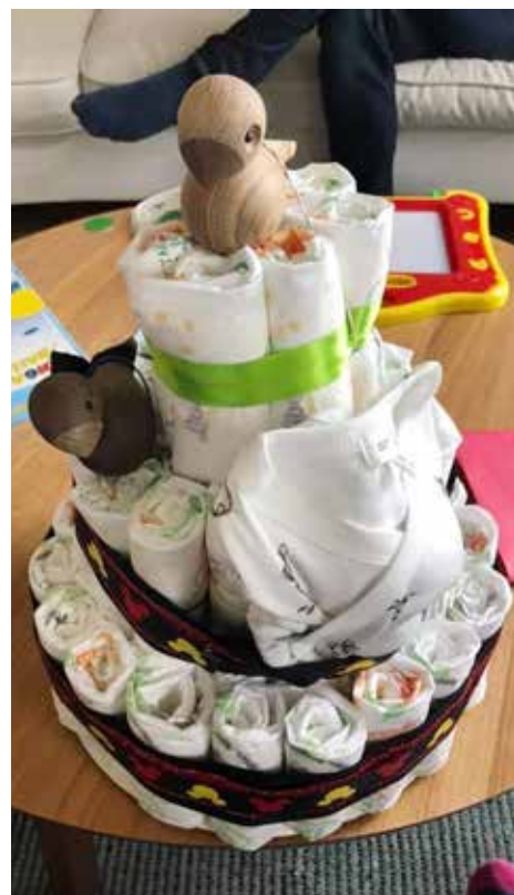
En blöjtårta är obligatorisk på varje babyshower. Den här fick Sanne av sina vänner.

släktingar där skickade en blöjtårta per post inför hennes babyshower.