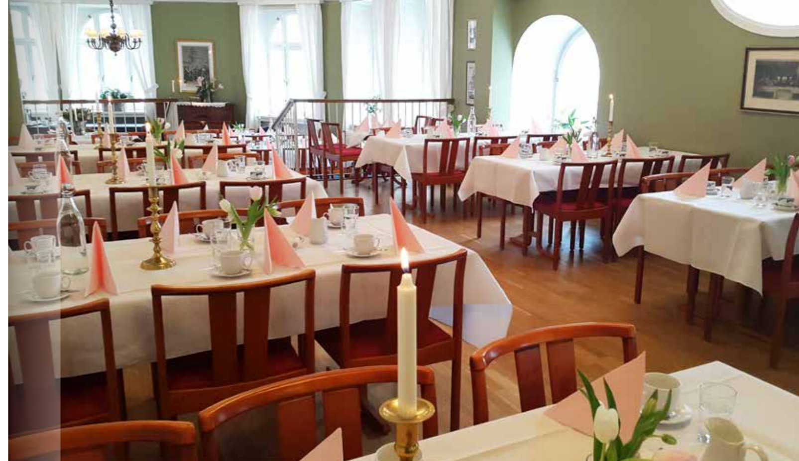
Församlingsvåningen på Västmannagatan 63.

GUSTAF VASA FÖRSAMLINGSEXPEDITION gustafvasa.bokning@svenskakyrkan.se 08-508 88 600