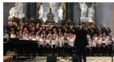
Adolf Fredriks musikklasser från konserten i Gustaf Vasa kyrka 2019.

Denna tidning är klimatneutral då vi kompenserar med Tricorona