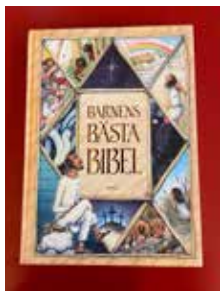
Barnens Bästa Bibel Skriven av biskop Sören Dalevi