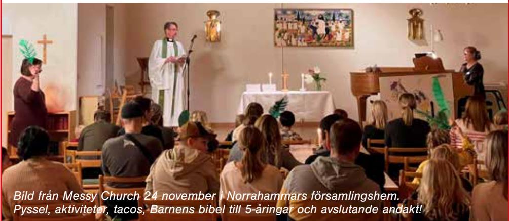
Bild från Messy Church 24 november i Norrahammars församlingshem. Pyssel, aktiviteter, tacos, Barnens bibel till 5-åringar och avslutande andakt!