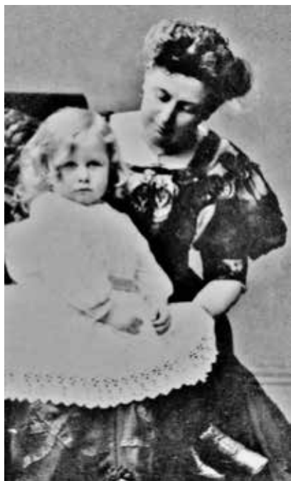
Reportagebild oktober 1906