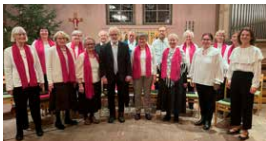
Norrahammar-Hovslätts kyrkokör. Trettondag Jul 6 januari i Kyrkvillan.