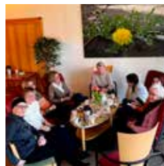
Diakongruppen planerar inför våren.