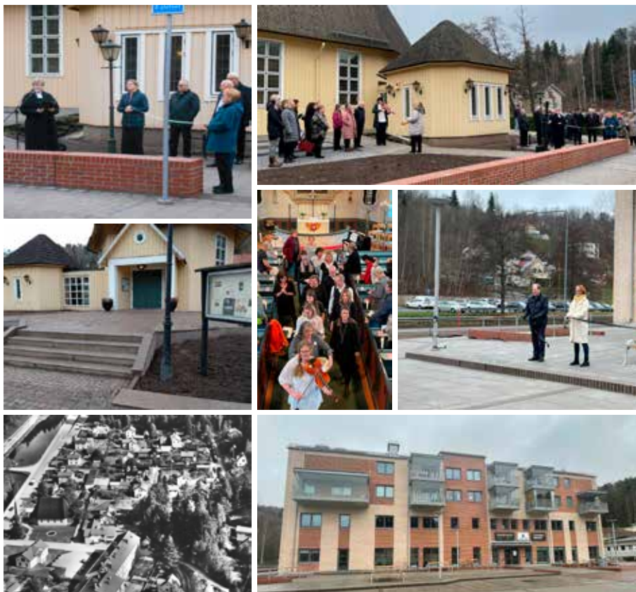
Flygfoto från omkring 1950.