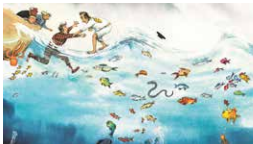
Illustrationer av Marcus-Gunnar Pettersson

Utställningen är tillgänglig tisdag-fredag klockan 10.00–16.00, söndagar i samband med gudstjänster samt vissa kvällar när det pågår verksamhet!