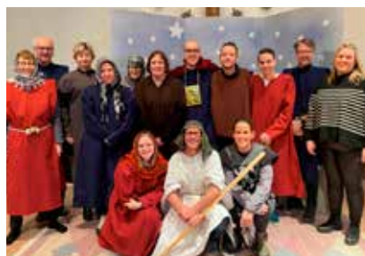
Dramat om Artaban, den fjärde vise mannen, spelades upp för årskurs 5 från Brodalskolan, Slätenskolan och Hovslättskolan.