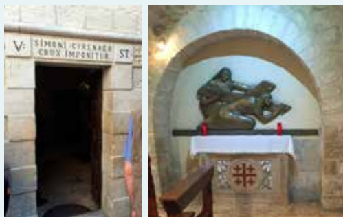
Porten in till kapellet och kapellet tillägnat Simon från Kyrene.

Under stilla veckan, som är veckan före påsk, framträder en särskild Simon i den bibliska berättelsen. Nej, jag tänker inte på lärjungen Simon Petrus denna gång, fastän det var han som tre gånger förnekade Jesus innan tuppen gol. Jag tänker på den man som troligen tillfälligt befann sig i Jerusalem, men som kom från Kyrene. Kyrene ligger i nuvarande Libyen, väster om Egypten, i Nordafrika. Under denna nytestamentliga tid var detta en koloni med romerskt styre och med en stor judisk befolkning. Kyrene blev tidigt en livlig handelsstad eftersom trakten bestod av gynnsam odlingsmark. Från denna plats kom Simon från Kyrene som figurerar i en bibelvers när Jesus är på väg till korsfästelsen på Golgata (Matt.27:32):