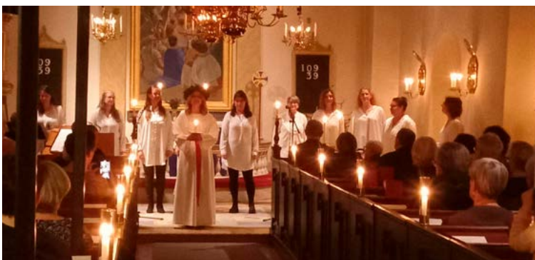
Kören Con Spirito Adventskonsert i Sandseryds kyrka 5 december.