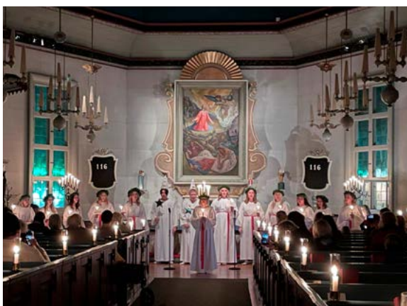
Lucia i Norrahammars kyrka 13 december.