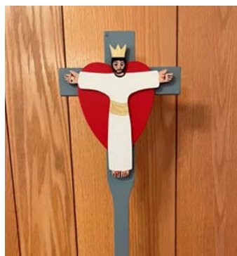
Processionskors för barn skänkt till församlingen. Eva Spångberg konstnär.