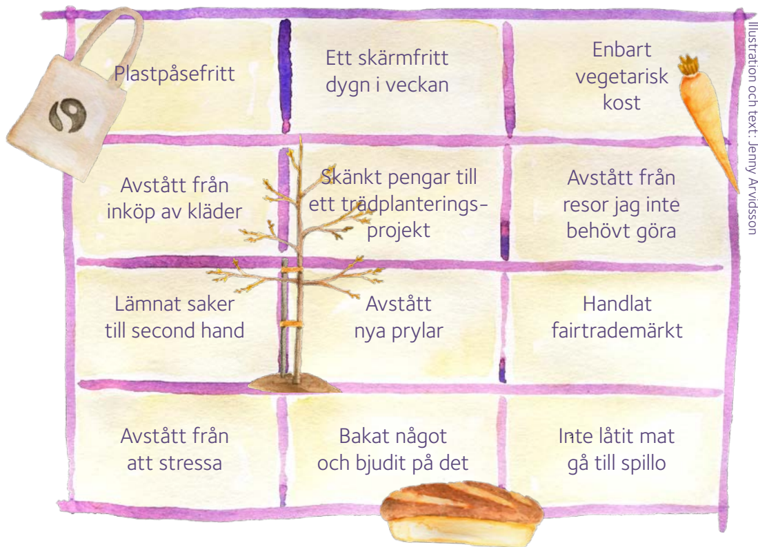
Illustration och text: Jenny Arvidsson

Kryssa för det du klarat under fastan 2022 (2 mars – 17 april)