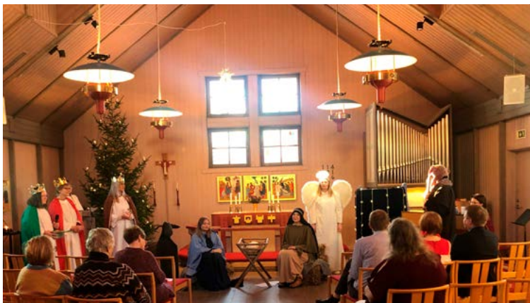
Levande julkrubba 24 december i Kyrkvillan.