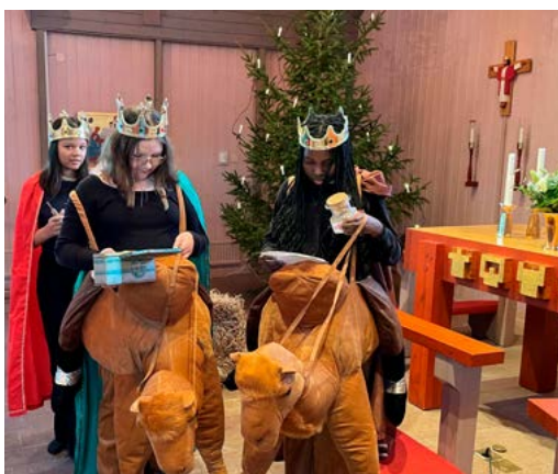
Trettondag Jul 6 januari i Kyrkvillan. Julspel där gruppen Sundays medverkade.