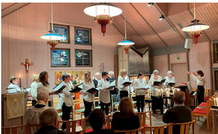
Kören på Kyndelsmässodagen 6 februari i Kyrkvillan.