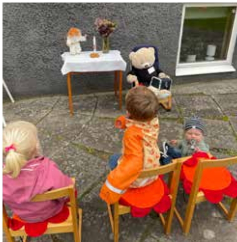
Vardagsgudstjänst utomhus med Öppna förskolan i Kyrkvillan 29 september.