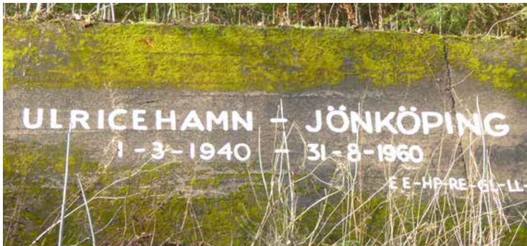
Ulricehamnsbanans minnestext Sandseryd

Borås-Ulricehamns Järnväg, senare Borås-Jönköpings Järnväg, är en nedlagd och nästan helt uppriven normalspårig järnväg som gick mellan Borås och Ulricehamn och senare förlängdes till Jönköping.