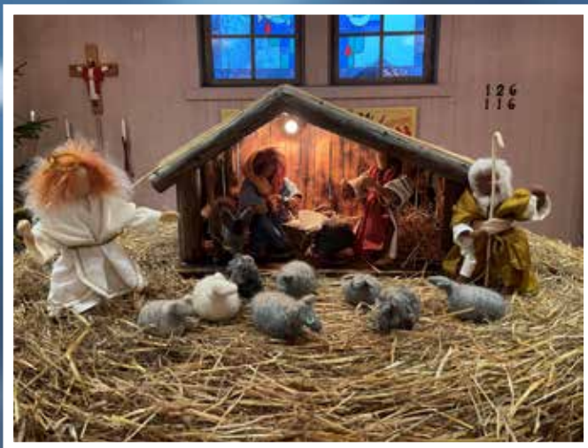
Julkrubba med Josef, Maria, Jesusbarn, herde, får och ängel.