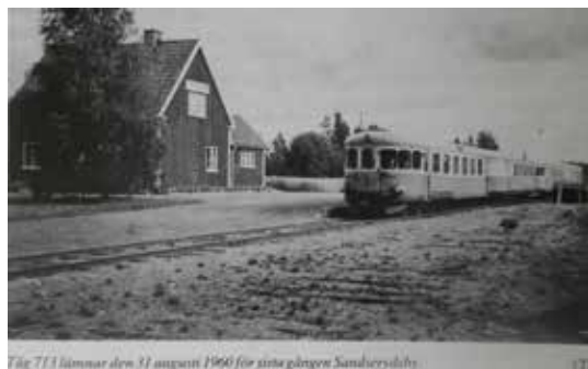
Tåget 713 lämnar den 31 augusti 1960 för sista gången Sandserydsby