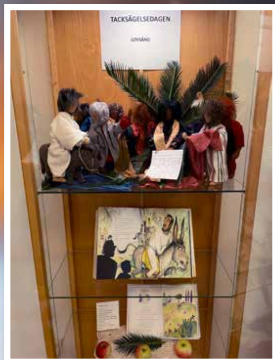
Bibelskåpet i Kyrkvillan med bibliska figurer, text ur Barnens Bästa Bibel och bön.

Figureerna används för att göra scener ur texter som följer kyrkoåret. Denna söndag var det Tacksägelsedagen. Titta gärna i skåpet när du kommer till Kyrkvillan nästa gång!