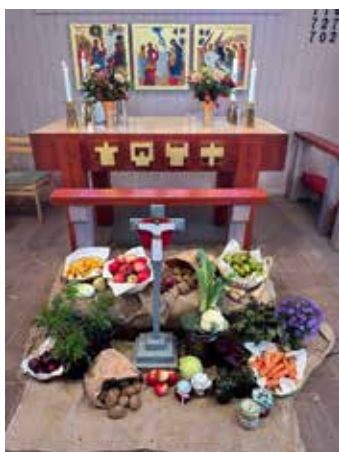
I Kyrkvillan firades Tacksägelsemäsas med skördealster som auktionäras ut efter kyrkokörens och sång-/musikelevs medverkan! Behållningen gick till ACT Svenska kyrkans internationella arbete!