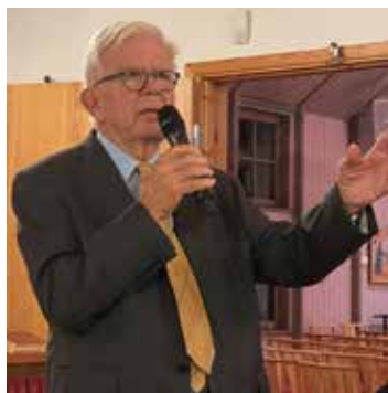
Församlingsafton i Kyrkvillan på FN-dagen 24 oktober med Alf Svensson som gästtalare. Fred, försoning och vänskap var nyckelorden.