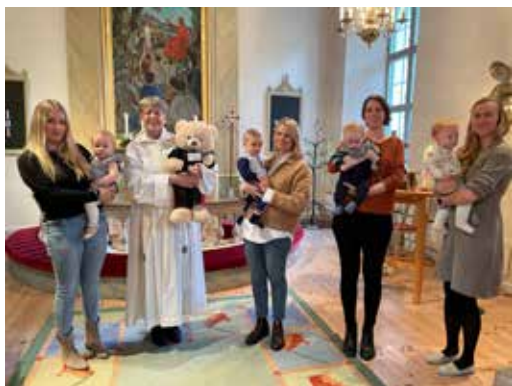
Dopfest i Sandseryds kyrka 6 oktober. Dopdroppe, bönbok och Barnens Bästa Bibels särtryck av dopet fick familjerna som gåva. Dopårta, kaffe och frukt i församlingshemmet efteråt. Nästa dopfest är den 15 mars i Kyrkvillan.