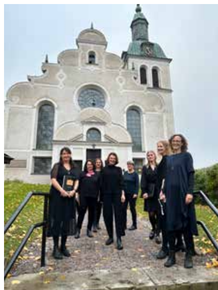
Damkören Con Spirito sjöng tillsammans med 80 körsångare med folkkära Sonja Aldén som solist i Gräna kyrka den 22 oktober. Konsert "Sånger för livet" arrangerades av Läkarmissionen och Svenska kyrkan. Det var ett tillfälle att mötas, njuta av härlig musik och dela ett viktigt budskap för en bättre värld.