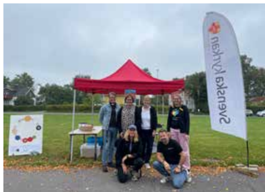
Norrahammars församling tillsammans med Månsarps församling mötte skolelever på Flahultsskolan på föreningsdagen 12 september.