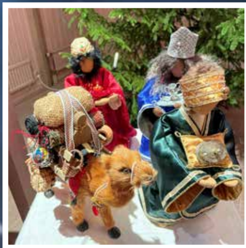
De tre vise männen och en kamel.