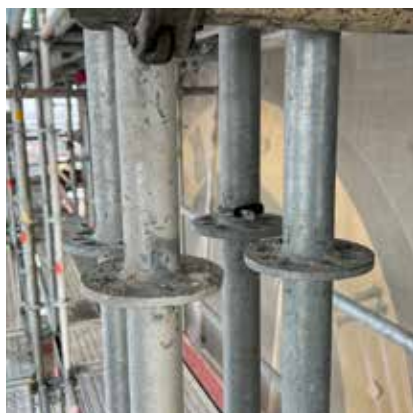
Fyra sammankopplade spiror krävs för att klara tyngden av byggställning.