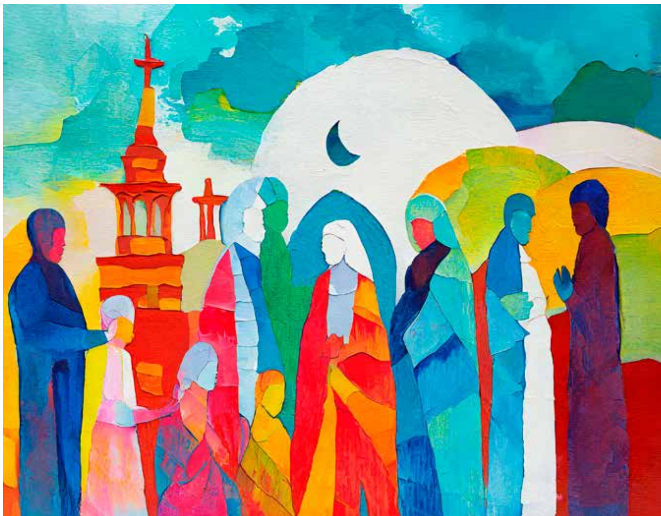
Att odla vänskap, bygga tillitsfulla relationer och goda strukturer för samverkan är något av det viktigaste vi kan göra för att skapa trygghet i vår stad. Efter påskupploppet i Linköping blåstes nytt liv i arbetet för dialog och samverkan mellan Linköpings kommun, Polismyndigheten, Svenska kyrkan och de tre muslimska församlingarna i Linköping. Bilden är AI-genererad.

sätt att arbeta och organisera sig, har erhållit nationell uppmärksamhet. Myndigheter, trossamfund, föreningar och nätverk har gemensamt värnat ytor för lyhörd och ömsesidig dialog samt gemensamma aktiviteter/aktioner i syfte att motverka missförstånd, polarisering, och oroligheter.