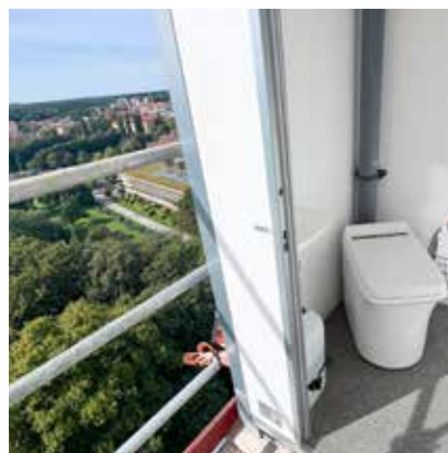
Linköpings högst belägna toalett, 48 meter över marken.

längre ner på ställningen och kan även stå i baracken och hugga sten när vädret är dåligt. Ibland räcker det att arbeta på läsidan. Där kan det vara vindstilla, sen går man runt på andra sidan och då blåser det nästan storm.