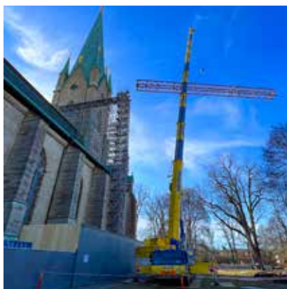
Balklyftet förra våren av den 37 meter långa och 10 ton tunga balken.