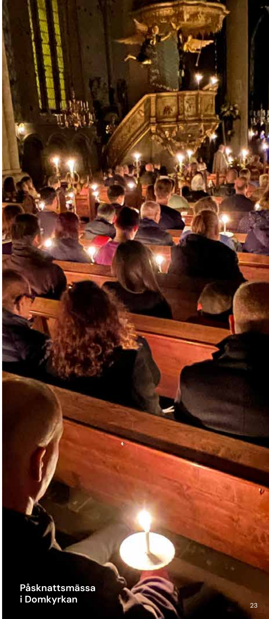
Påsknattsmässa i Domkyrkan