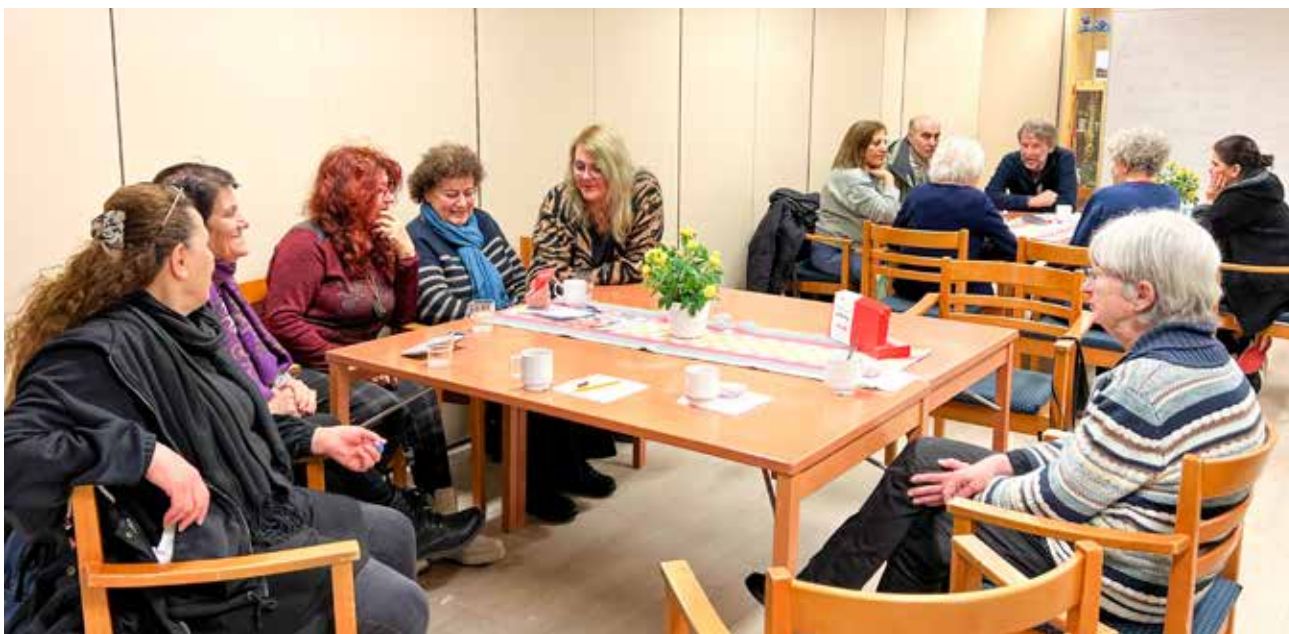
Det är full aktivitet när Språkcaféet träffas i Berga kyrka på onsdagar 15.30–17.00.