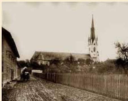
Domkyrkan från norr längs Gråbrödragatan. Byggnaderna till vänster är Curmanska magasinerna som numera finns i Gamla Linköping. Fotot är från 1900-talets början.

Vid 1500-talets början var så det medeltida bygget klart. Över Nicolaukapellet och Thomaskapellet fanns två torn. Även ett mindre, en så kallad takryttare, satt över långhuset. I väster fanns inget torn utan istället en praktgavel med ett stort rosettfönster. Vid mitten av 1700-talet ersattes praktgaveln med ett torn efter ritningar av Carl Hårleman. Det torn vi i dag har är ritat av Helgo Zettervall och stod klart 1886. De två östtornens överbyggnader tillkom vid en omfattande restaurering på 1960-talet, liksom en omgestaltning av den Zettervallska tornspiran.