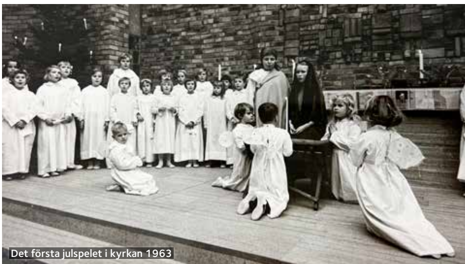
Det första julspelet i kyrkan 1963