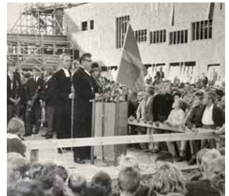
Biskop Ragnar Askmark inviger klockstapeln 1960 mitt under bygget av kyrkan.