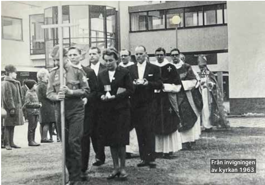
Från invigningen av kyrkan 1963