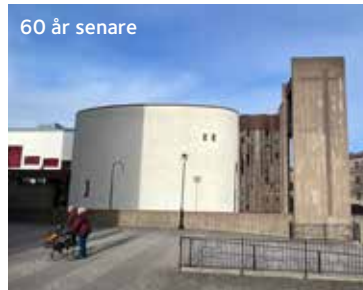
60 år senare