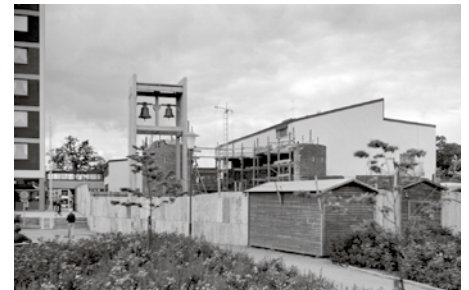
Tre bilder från det första kyrkbygget i Linköping sen medeltiden.