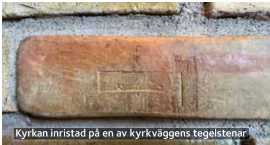
Kyrkan inristad på en av kyrkväggens tegelstenar