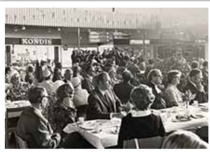
Samkväm i Ekholmens centrum efter invigningsgudstjänsten.