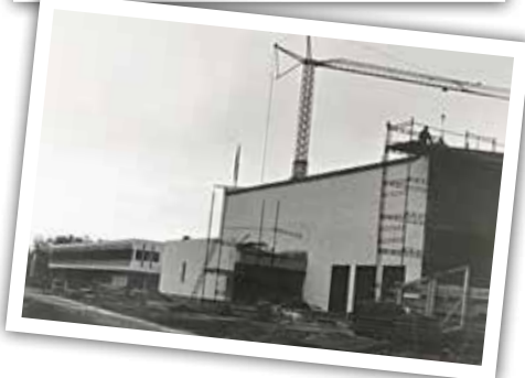
Från bygget av S:t Hans kyrka.