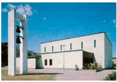
Fram till 1993 var kyrkan vit.