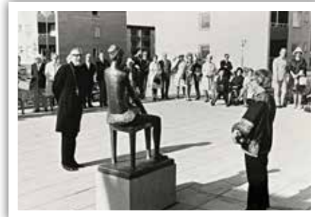
Biskop Ragnar Askmark inviger konstverket "Före entrén" av Ebba Hedqvist 1973.