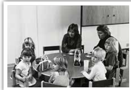
Barntimmar i S:t Hansgården.