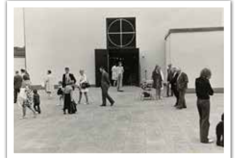
Innan församlinggården byggdes till 1993 så kom man ut på ett kyrktorg direkt från kyrksalen.