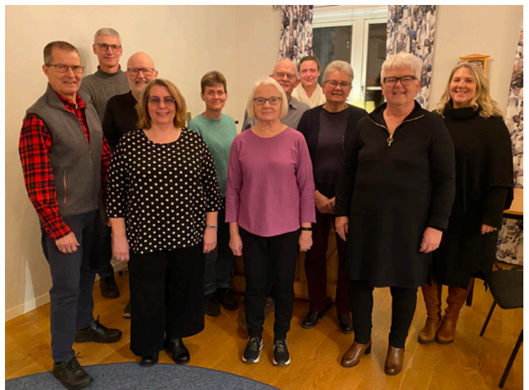
Övning med några i Slättåkra-Kvibille kyrkokör.