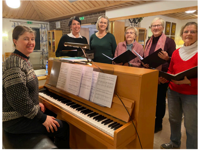
Övning med några i Enslövskören.