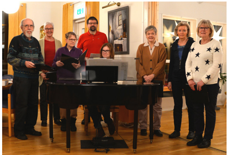
Övning med några i Oskarskören.

ÄR DU SUGEN PÅ ATT GÅ MED I NÅGON AV VÅRA KÖRER. HÖR AV DIG TILL NÅGON AV KYRKANS KÖRLEDARE ELLER TILL NÅGON SOM DU VET SJUNGER I KÖREN OCH HÖR OM DERAS ERFARENHETER.