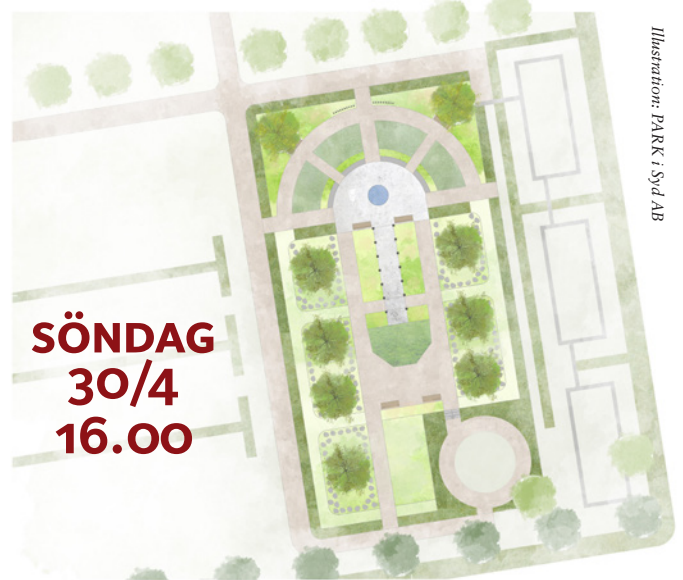
Illustration: PARK i Syd AB

Efter hösten och vinterns anläggningsarbete är det nu dags att inviga kyrkogårdens nya inslag med ceremoniplats och askgravkvarter. Notera datum och tid nu. Vi återkommer med mer information i våra övriga kanaler.