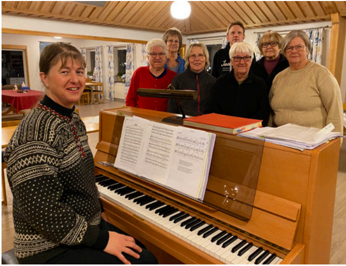
Övning med några i "Nya Vänner".

Förutom reportaget om kyrkokören i Getinge åkte vi runt och fotograferade pastoratets övriga kyrkokörer. Alla kunde tyvärr inte närvara, men här några av de församlingsbor som är med och bidrar till den musikaliska delen av kyrkans verksamhet.