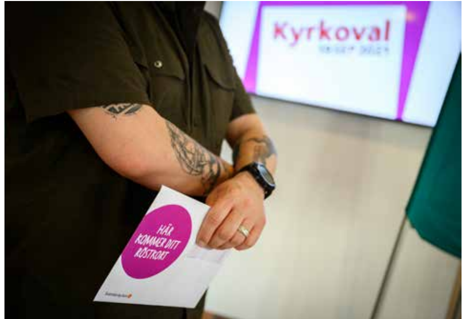
Alla medlemmar som är 16 år och äldre kan rösta om hur de vill att Svenska kyrkan ska styras i kyrkovalet 2021.

På regional stiftsnivå fattar man beslut om bidrag till renoveringar av kyrkor, samordning av olika typer av stöd för till exempel härbärgen vintertid, stöd för funktionednedsatta, hjälp till flyktingar och integration, klimatsatsningar och så vidare. På nationell nivå fattas övergripande beslut som påverkar hela Svenska kyrkan. Ett sådant exempel är vilka psalmer som ska finnas med i psalm-