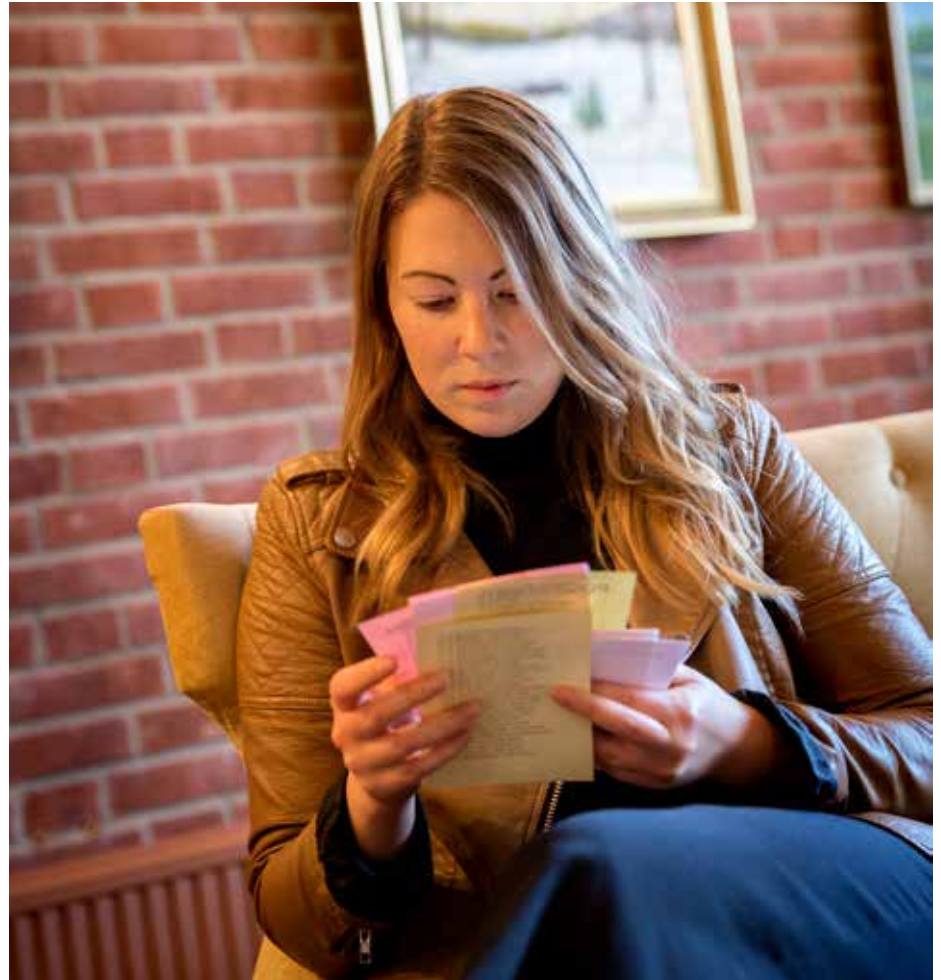
Alla medlemmar som är 16 år och äldre kan rösta om hur de vill att Svenska kyrkan ska styras i kyrkovalet 2021.

I kyrkovalet väljs kandidater för kyrkomötet, stiftsfullmäktige och kyrkofullmäktige, vilket motsvarar