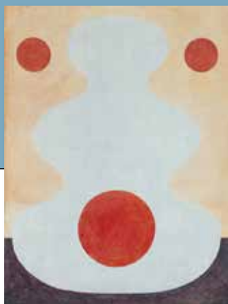
Illustration: Magnus Dahl

Från den 1 januari 2024 går Tävelsås, Vederslövs och Kalvsviks församlingar samman till en församling. Den nya församlingen kommer heta Tävelsås, Vederslövs och Kalvsviks församling. I samband med sammanslagningen har ett nytt församlingsråd utsetts. I övrigt är det mesta som tidigare. Bakgrunden till sammanslagningen är att församlingarna var för sig inte har möjlighet att fira gudstjänst med den frekvens som kyrkoordningen kräver. Församlingarna har länge haft dispens att fira gudstjänst tillsammans och verkat som en församling.