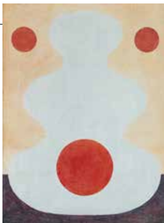
Illustration: Magnus Dahl