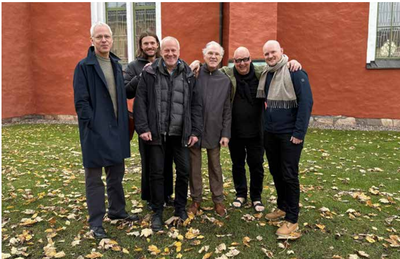
Representanter från de sex olika arkitektfirmorna som ska lämna förslag.

De sex arkitektbolagen som har fått i uppdrag att komma in med förslag har besökt Viås för att få inspiration och de har även fått tillgång till den behovsinventering som genomförts.