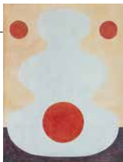
Illustration: Magnus Dahl

Vi bjuder på korv med bröd, läsk och snacks.