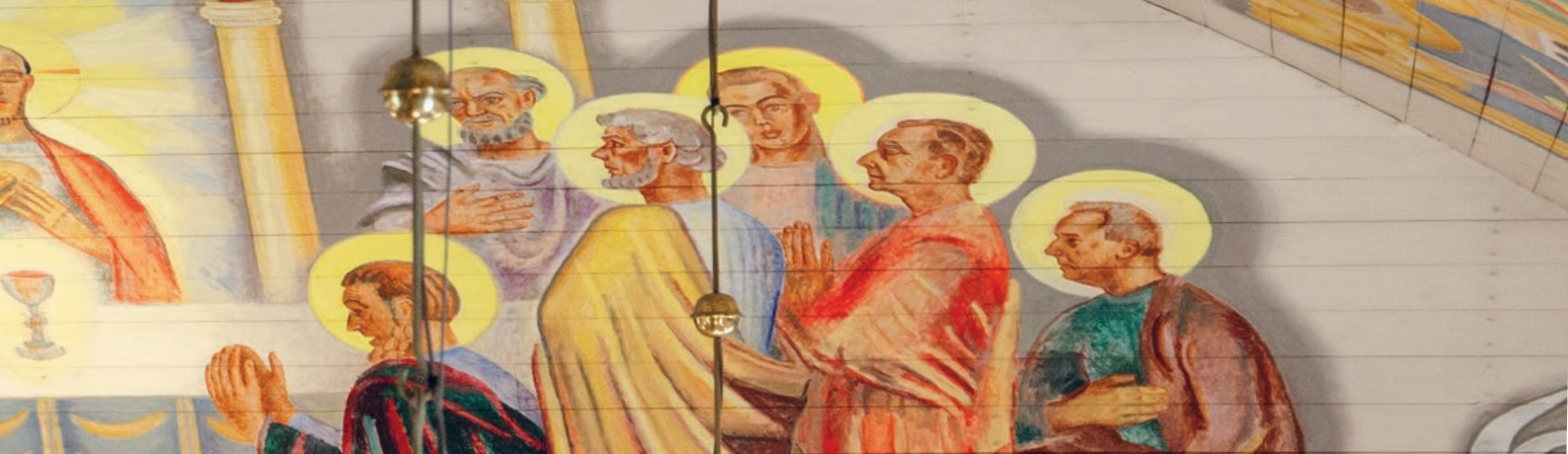
Del av takmålningen i Träslövsläge kyrka.