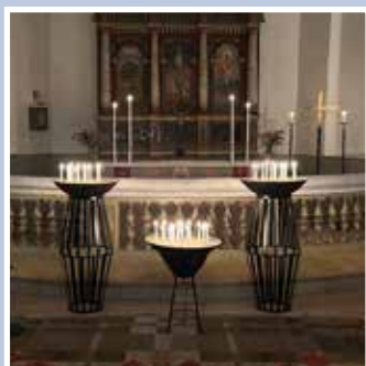
Spekeröds kyrka – Allhelgonadagen