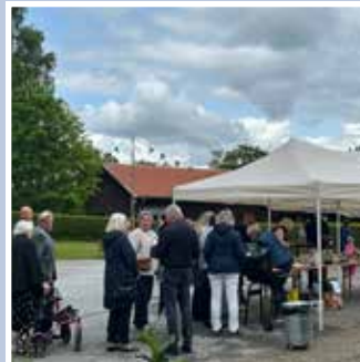
Vårfest – Pingstdagen