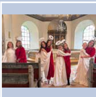
Rosetterna – Den Helige Mikael's dag