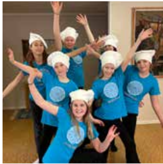
Rosetterna – Fastlagsdagen