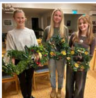
Julkranstävling – Spekeröds församlingshem

Ett urval av allt det som hänt i vår församling under 2025. Tack till alla som medverkat och alla som har kommit och besökt oss!