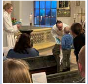
Utdelning av Barnets Bibel – Kyndelmässodagen