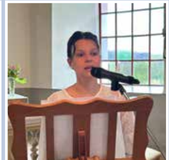
Linnéa – Spekeröds kyrka i juni