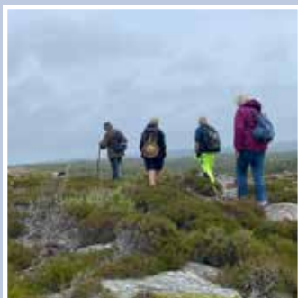
Pilgrimsvandring – Härmanö Huvud