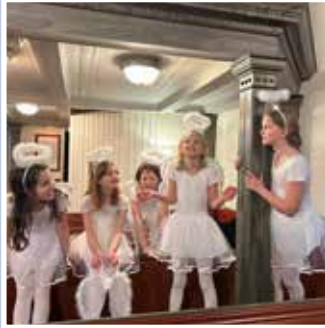
Ånglakören – Kyndelmässodagen