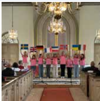
Ånglakören – Pingstdagen