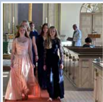
Celestia i Ucklums kyrka