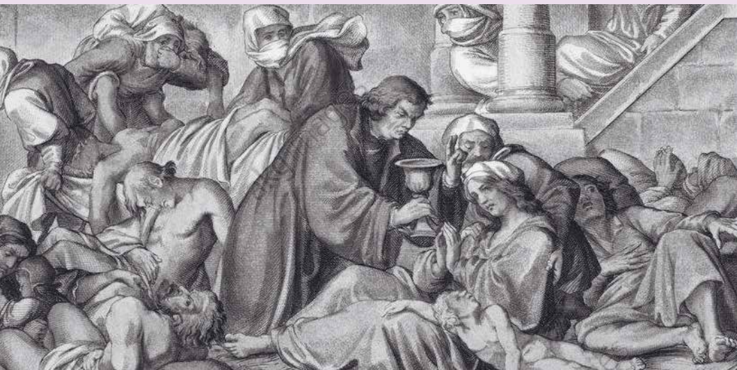
Luther stannar kvar under pesten och delar ut nattvard till de sjuka.