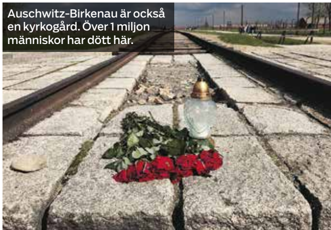
Auschwitz-Birkenau är också en kyrkogård. Över 1 miljon människor har dött här.

”Ungdomarna pratar på djupet om stora frågor i ett tryggt forum och blir sedda och bekräftade, av både kompisar och andra vuxna. Då händer det saker och alla gör sin egen resa.”