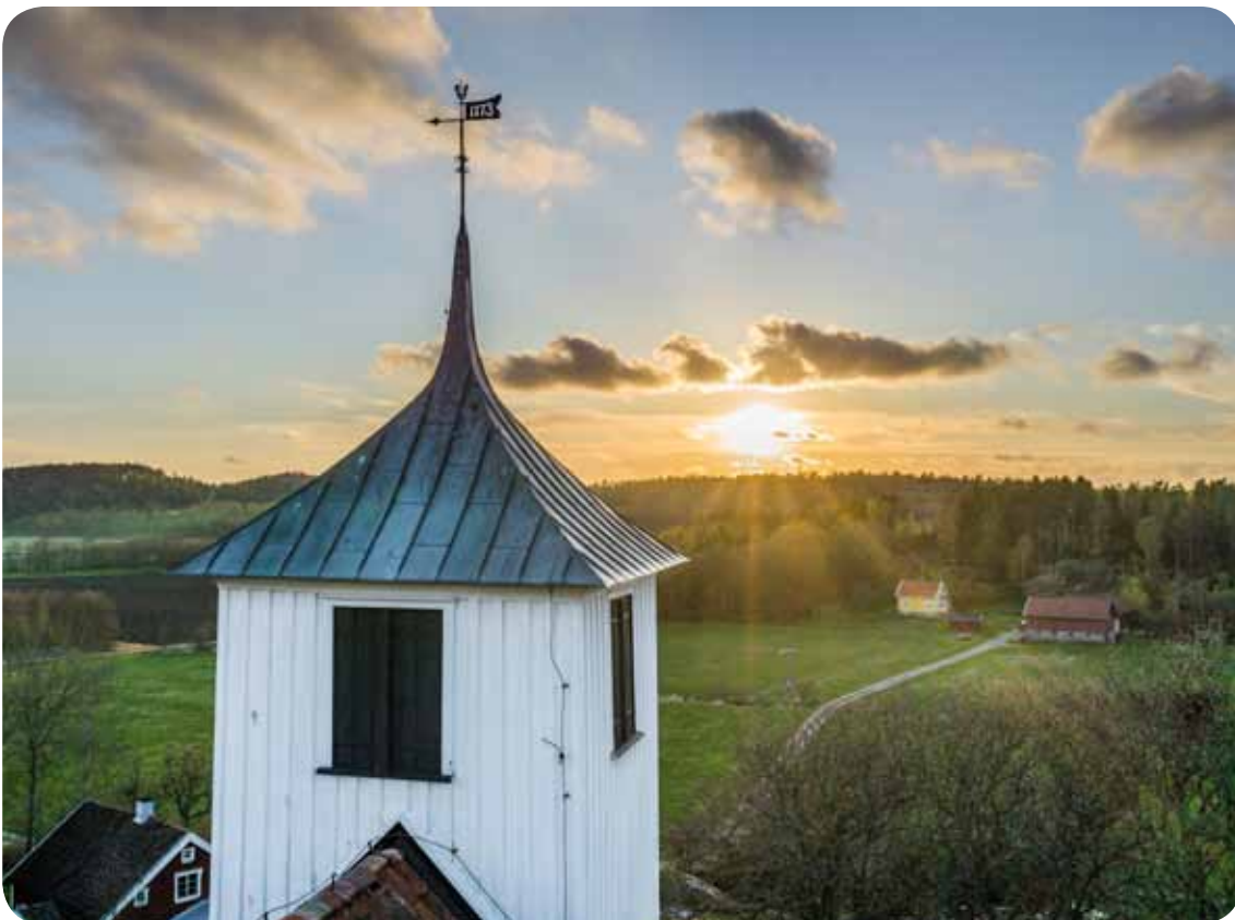
Bottna kyrka.