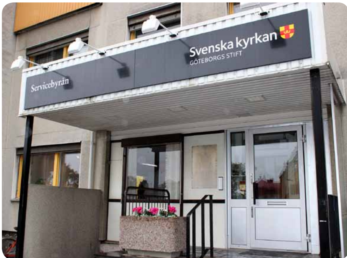
1 september 2015 öppnade Göteborgs stifts servicebyrå sitt första kontor i Uddevalla. Servicebyrån säljer administrationstjänster till församlingarna, för att de ska kunna fokusera på sin grundläggande uppgift.