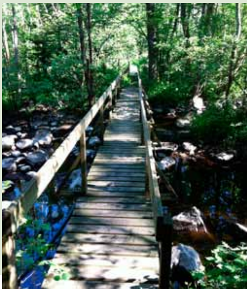
Sju Strömmar utgör ett särskilt värdefullt naturområde.

Sju Strömmar ingår i Natura 2000, ett nätverk av särskilt värdefulla naturområden inom EU som syftar till att bevara den biologiska mångfalden i ett europeiskt perspektiv.