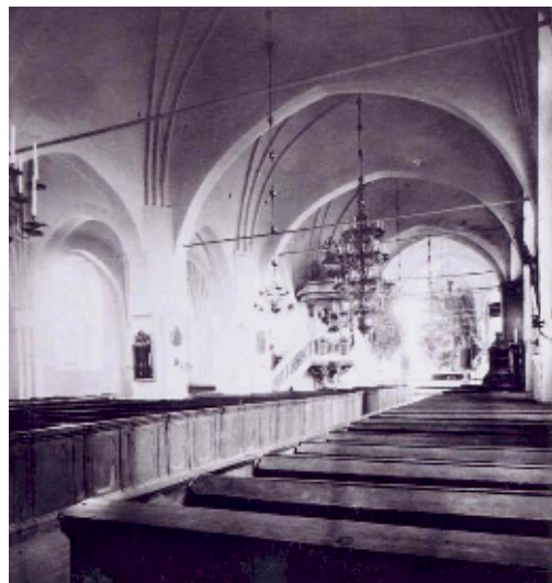
Kyrkorummet fotograferat före 1897, då bänkinredningen var sluten, till sina äldsta delar från 1600-talet

Vid en omläggning 1837 blev skiffer lagt på långhustaketets södra sida, istället för tidigare spån. Norrsidans och tornets spåntäckningar behölls, men vartefter de slets ut övervägde församlingen att ersätta även dem med skiffer. Antagligen ställde det sig för dyrt, eftersom upprepade reparationer och tjärstrykningar skedde fram till 1883, då istället järnplåt lades på båda långhusets takfall. Tornets spånbeklädnad består alltjämt.