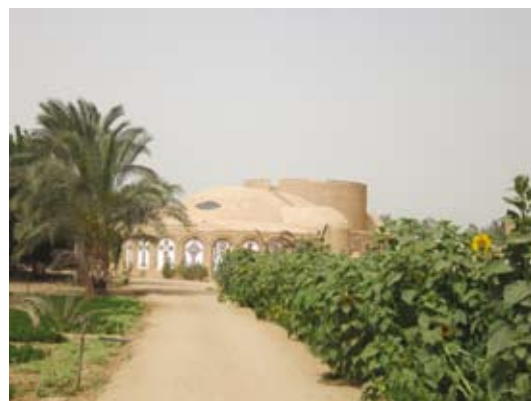
Kyrkan vid Anafora