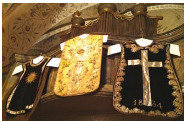
Efter gudstjänsten i Tensta kyrka den 8 juli visades de textila skatter som finns i kyrkans gömmor. Det mesta används regelbundet under årets gudstjänster. På bilden tre mycket gamla mässhakar med intressant historia.

Se också predikoturererna i UNT och på www.svenskakyrkan.se/vattholma